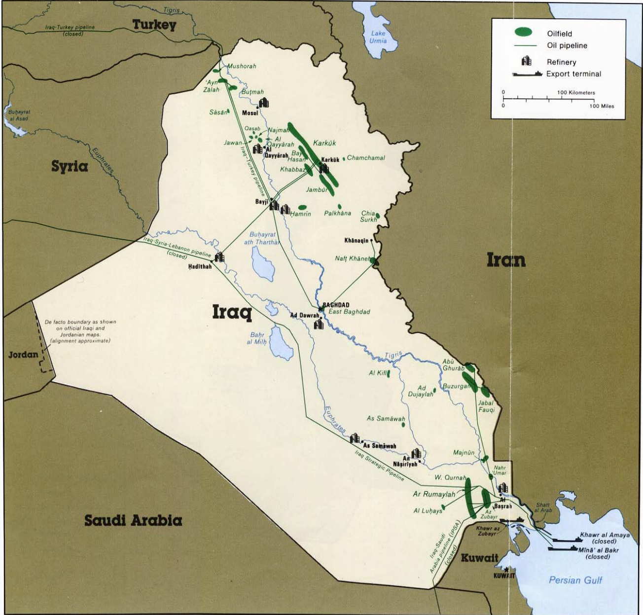
Oilfields and Facilities