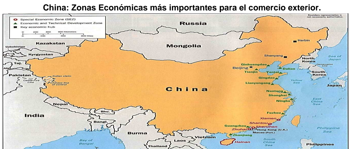
Mapa No. 1

Durante 1992 y 1994 el gobierno chino decidió reabrir la zona de Pudong en Shanghai que se encontraba en construcción y la zona del Yangpu expandiendo y ratificando así su apertura total hacia el comercio exterior con 30 ciudades y 9 regiones. Tomando al delta del Río Perla y el delta del Río Yangtze como base, se establecieron las regiones económicas más importantes de China y a su vez se establecieron 15 zonas libres de derechos aduaneros. 16 (Véase Mapa No.1)