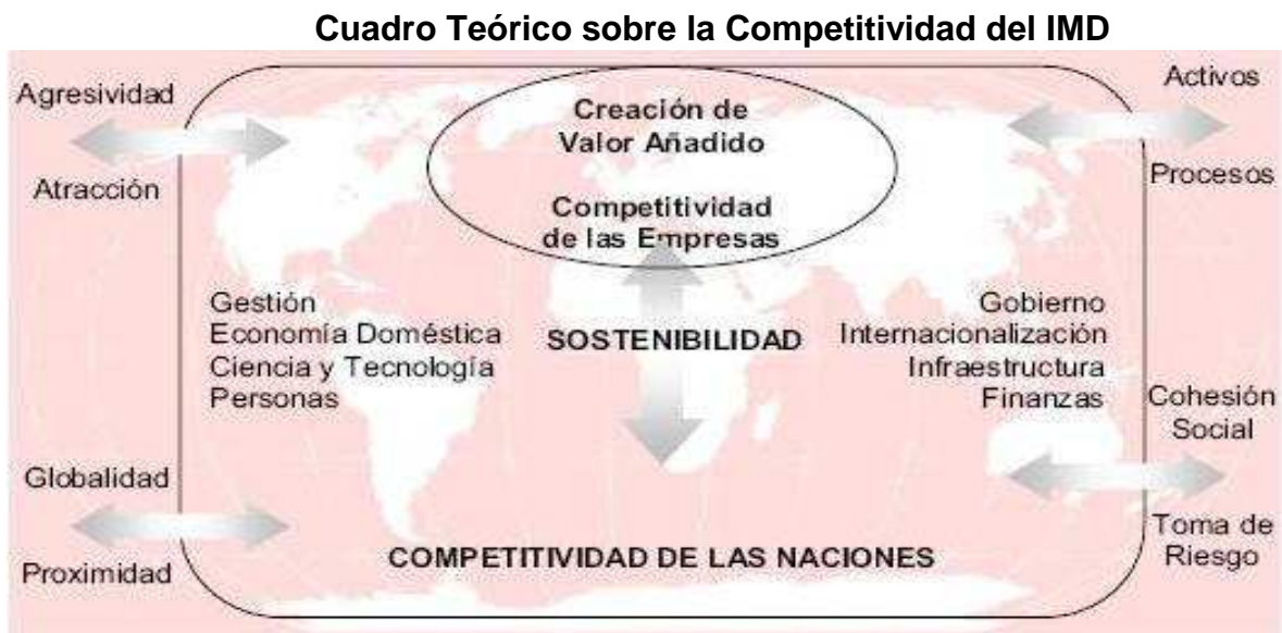
Gráfico No. 1