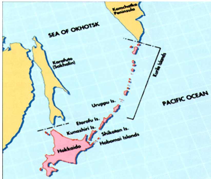
Figura 3. Demarcación convenida en 1875 mediante el Tratado para el Intercambio de Sajalín (para Rusia) por las islas Kuriles (para Japón).