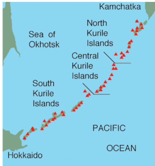
Figura 2. Archipiélago de las islas Kuriles en el Mar de Okhotsk