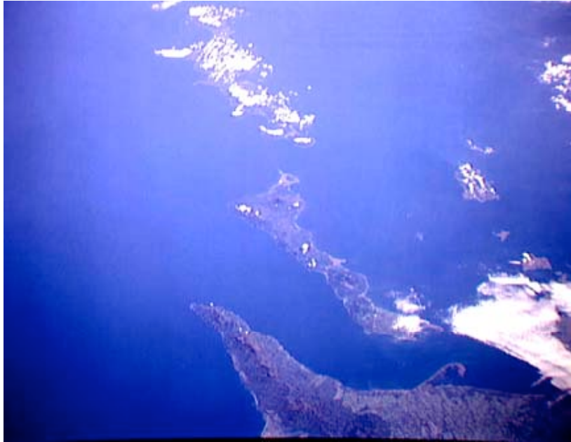
Figura 1. Fotografía tomada desde el espacio de los Territorios del Norte. Al sur, península de Hokkaido, al centro la isla de Kunashiri, al norte la isla de Etofuru.