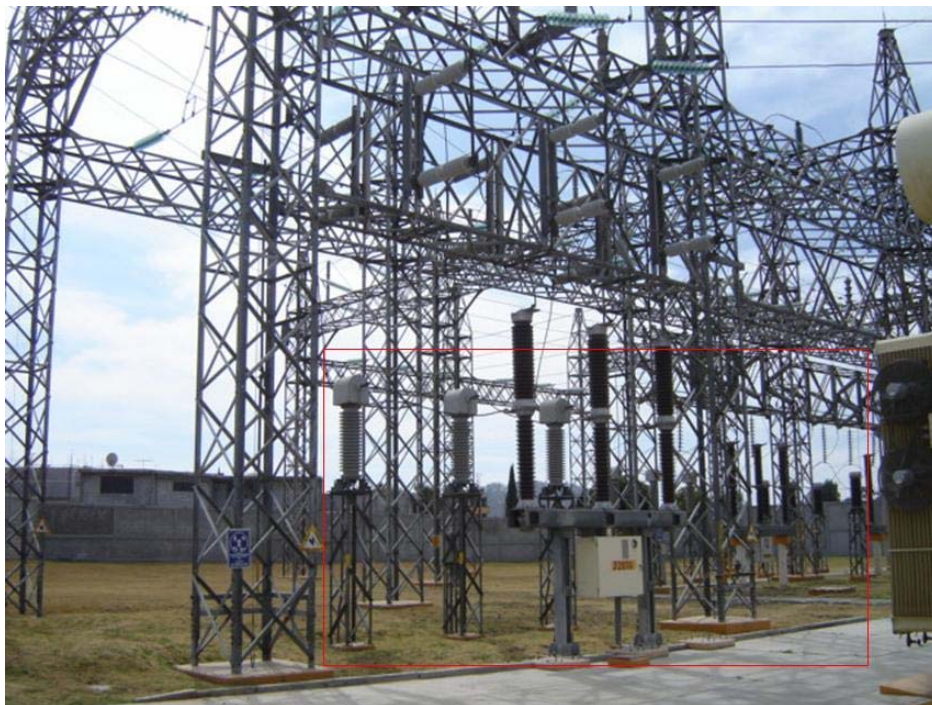
Figura A9 Interruptores de potencia Puebla 2000