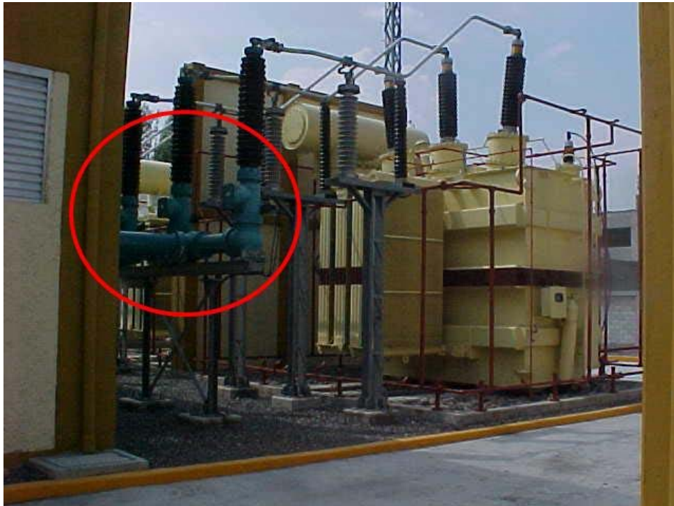
Figura A3 Boquillas SF6-Aire 5 de Mayo