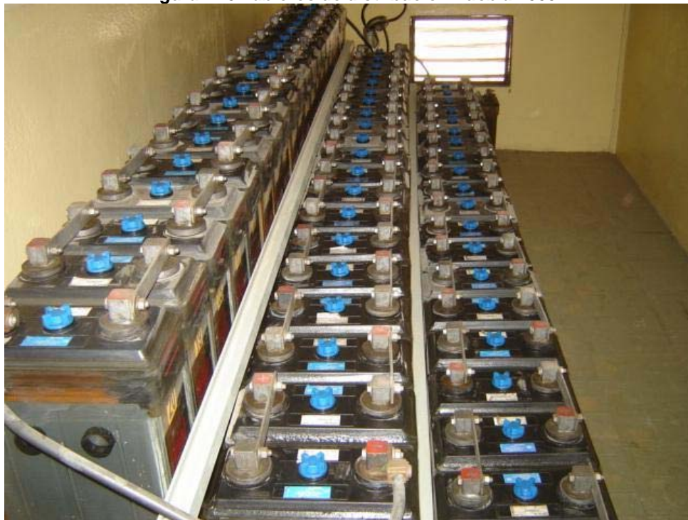
Figura A11 Cuarto de baterías y baterías ácido-plomo Puebla 2000