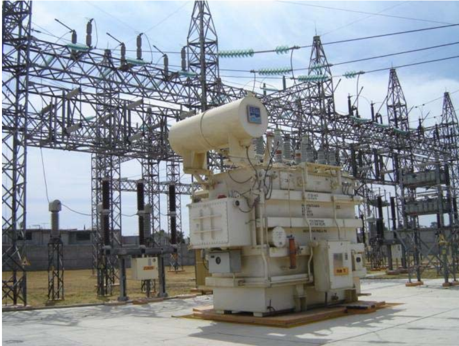
Figura A8 Transformador de potencia Puebla 2000