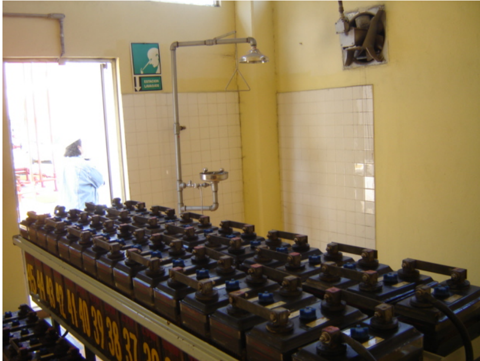
Figura A6 Cuarto de baterías y baterías ácido-plomo