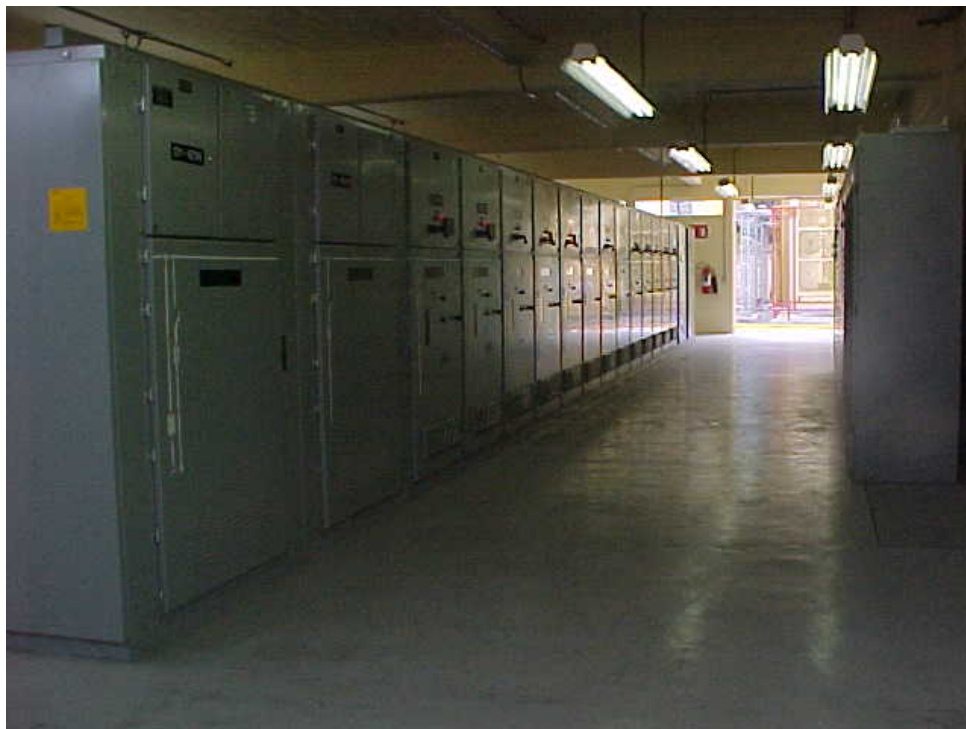
Figura A5 Tableros de distribución 5 de Mayo