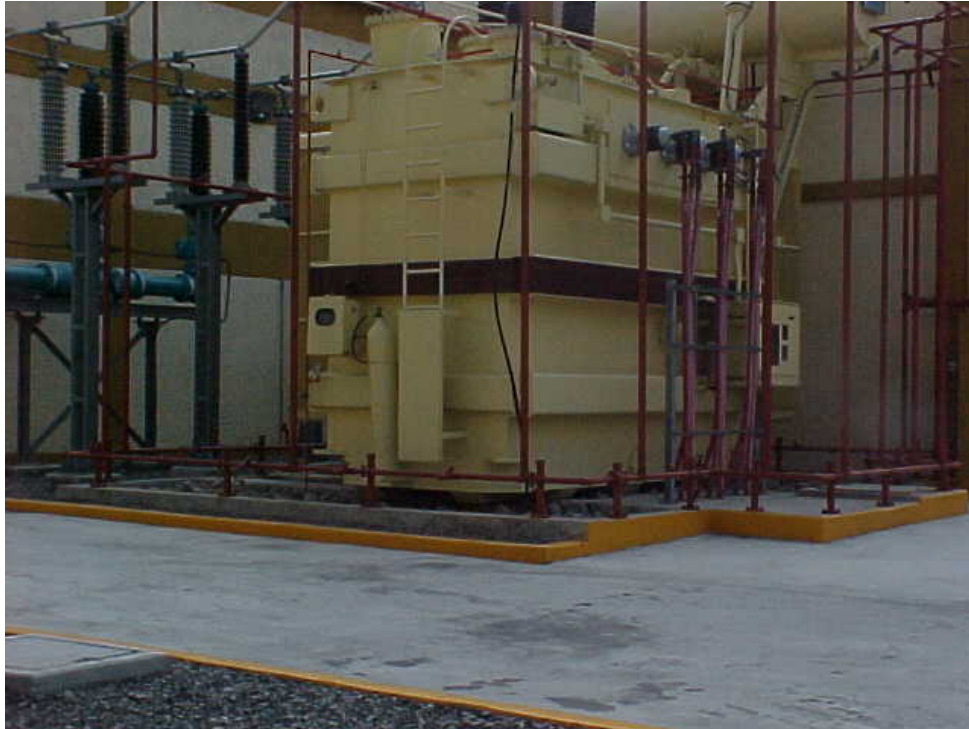
Figura A2 Transformador de potencia 5 de Mayo