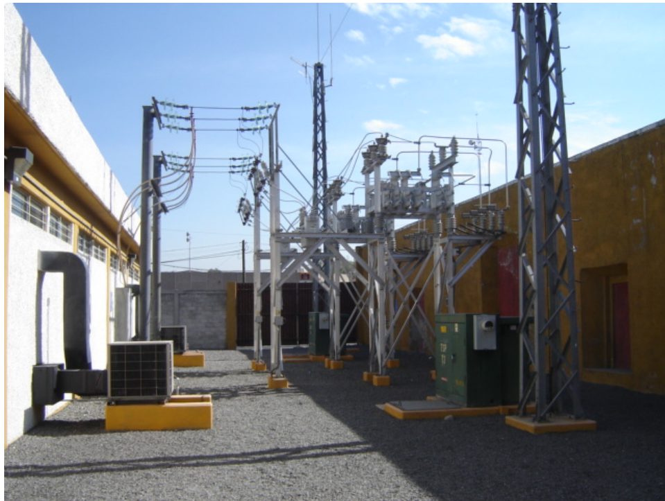
Figura A1 Banco de Capacitores 5 de Mayo