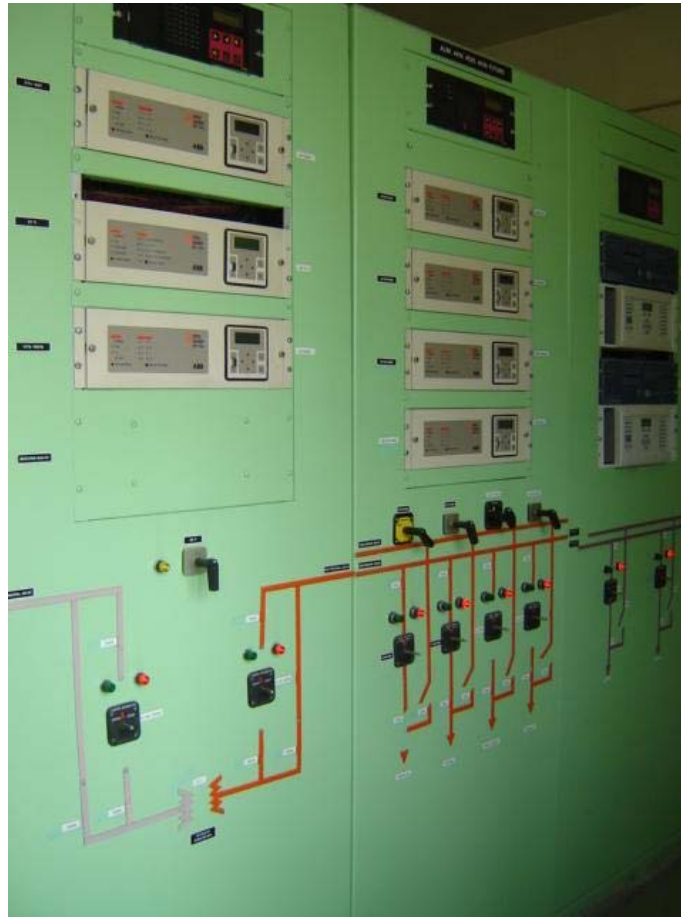
Figura A10 Tableros de distribución Puebla 2000