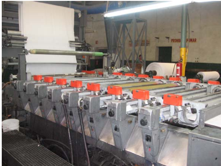
Figura 21 Máquina estampadora stork.