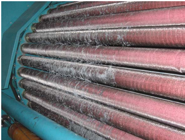
Figura 23 Exceso de material en cardas.