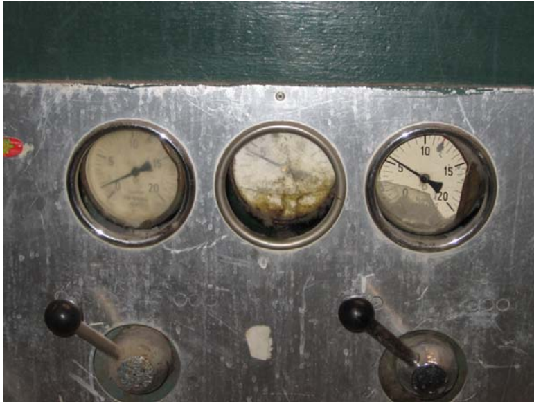
Figura 20 Maquinaria antigua.