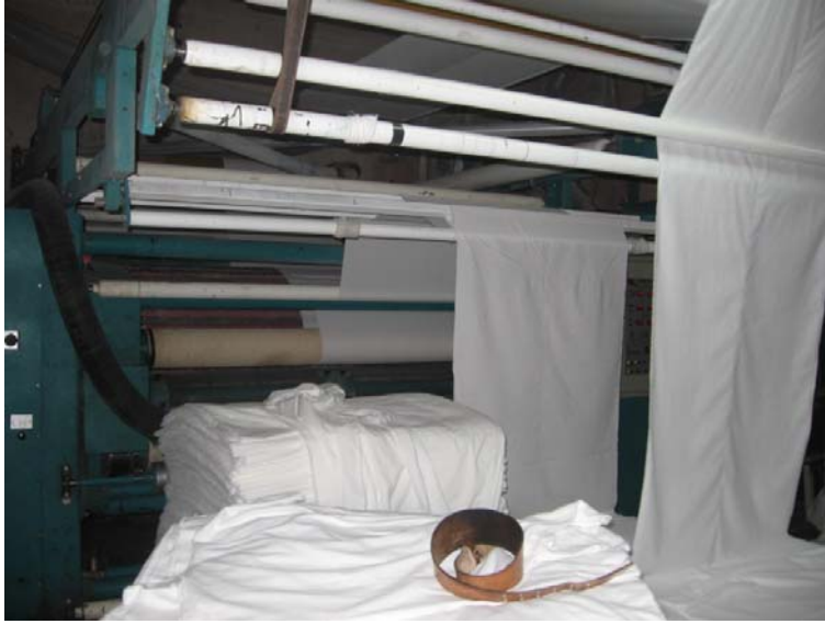
Figura 22 Máquina afelpadora.