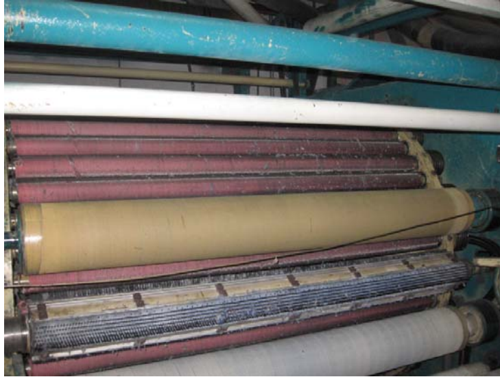
Figura 24 Rodillos desgastados.