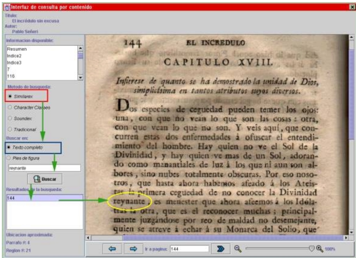
Figura F.2 Interfaz de consulta en contenido

En esta interfaz finalmente, el usuario podrá hojear digitalmente el libro seleccionado y consultarlo a través del sistema de búsqueda en contenido del sistema CIText.