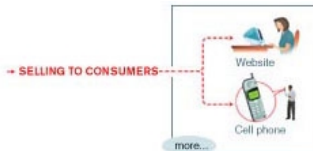
Figura 2.2 Paradigma Negocio a Cliente (b2c)

El cliente puede comparar con la venta al detalle de manera electrónica. Esta categoría ha tenido gran aceptación y se ha ampliado sobre manera gracias al WWW, ya que existen diversos centros comerciales (del inglés malls) por todo Internet ofreciendo toda clase de bienes de consumo, que van desde pasteles y vinos hasta computadoras.