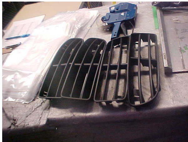
Figura 3. Rejillas de fascias

Algunos de los productos que se fabrican en Peguform México los podemos apreciar de la figura 3 a la 7. Fascias, Spoilers, Porta placas, Loderas entre otros.