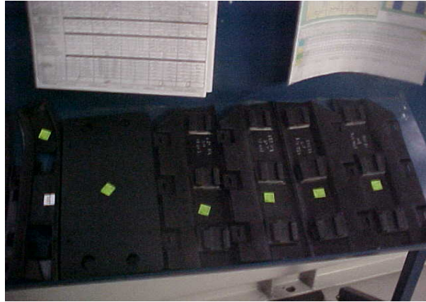
Figura 5. Porta placas y guías de montaje