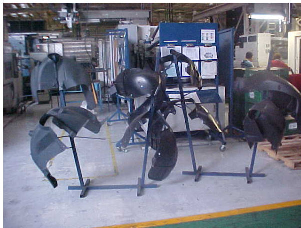
Figura 4. Loderas