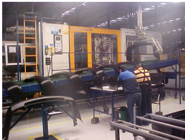
Figura 6. Inyección de fascias para Jetta A4