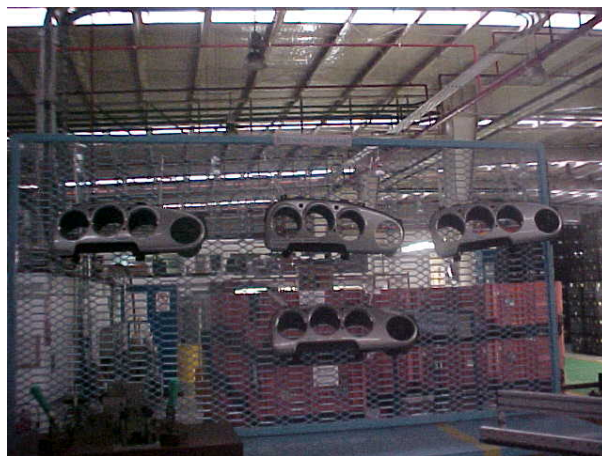
Figura 7. Clusters para PT Cruiser