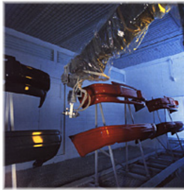
Figura 1. Productos muestra

En junio de 1999 la ITV América otorgó a Peguform Hella México el Certificado según las directrices de la Asociación de la Industria del Automóvil VDA 6.1.