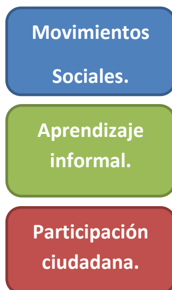
Figura 1: componentes.

Por tanto se realizó un proceso de aproximación para el análisis de este movimiento. Se tomaron en cuenta tres componentes para llevar a cabo este proceso: primero que nada la educación, pero entendida desde el enfoque de la educación informal. El segundo, los movimientos sociales, para tener un acercamiento más consciente y completo del movimiento como tal. Y por último, se tomó a la participación, entendida desde el proceso de participación que se realiza desde la ciudadanía.