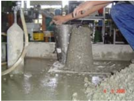
Figura J.1 Prueba de revenimiento con material de madera Elaboración propia