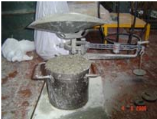
Figura J.2 Prueba de revenimiento con material de madera Elaboración propia