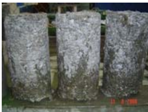
Figura J.4 Cilindros de madera a 7 días recién extraídos del estanque Elaboración propia