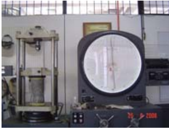
Figura J.6 Cilindro de madera a 21 días en prueba de compresión Elaboración propia