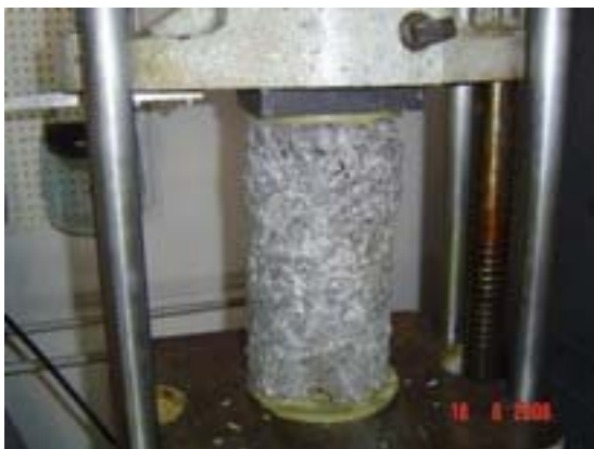
Figura J.5 Cilindro de madera a 14 días en prueba de compresión