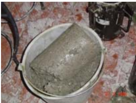
Figura J.3 Cilindro de madera que no resistió el descimbrado Elaboración propia