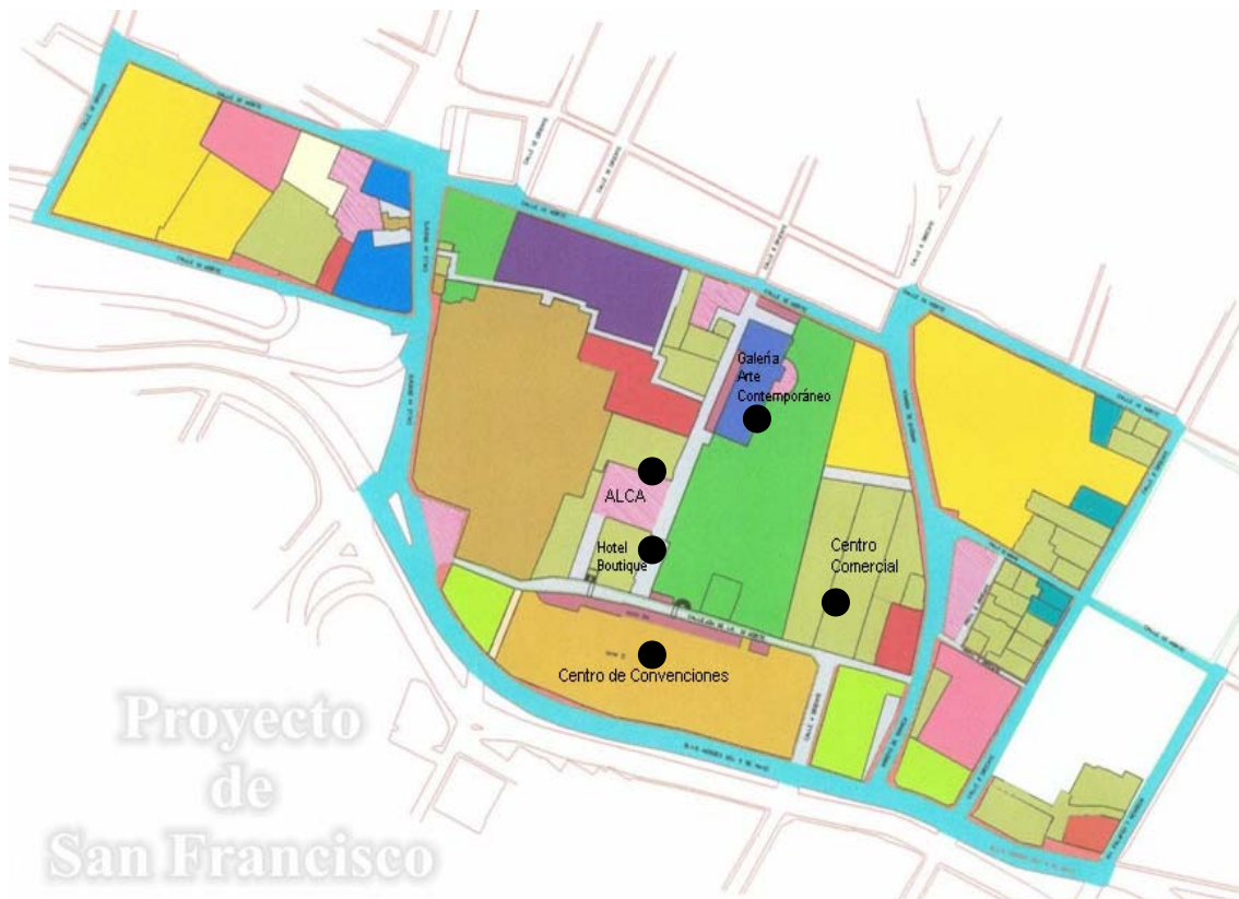
Figura 3.2. Mapa mostrando las cinco fábricas.

los Pescaditos. Es así que para esta investigación debido a la gran extensión del Paseo de San Francisco, sólo se estudiaron cinco fábricas: La Guía, La Oriental, Casa Latisnere, La Violeta y La Piel del Tigre. Se eligieron estas fábricas debido a que se encuentran dentro del Proyecto Paseo San Francisco, donde están siendo recuperadas y reutilizadas para nuevos proyectos.