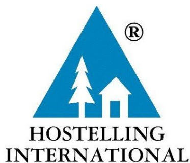
Figura 4.4 Logotipo de la Marca Hostelling International

Los hostales afiliados deben cumplir con los estándares de calidad en la operación y el servicio definidos por la Federación Internacional de Albergues Juveniles (IYHF), y que se identifican a nivel mundial con el símbolo de un árbol y una casa dentro de un triángulo azul, reconocido por los mochileros y viajeros en el mundo como sinónimo de calidad, como se muestra en la Figura 4.4 a continuación.