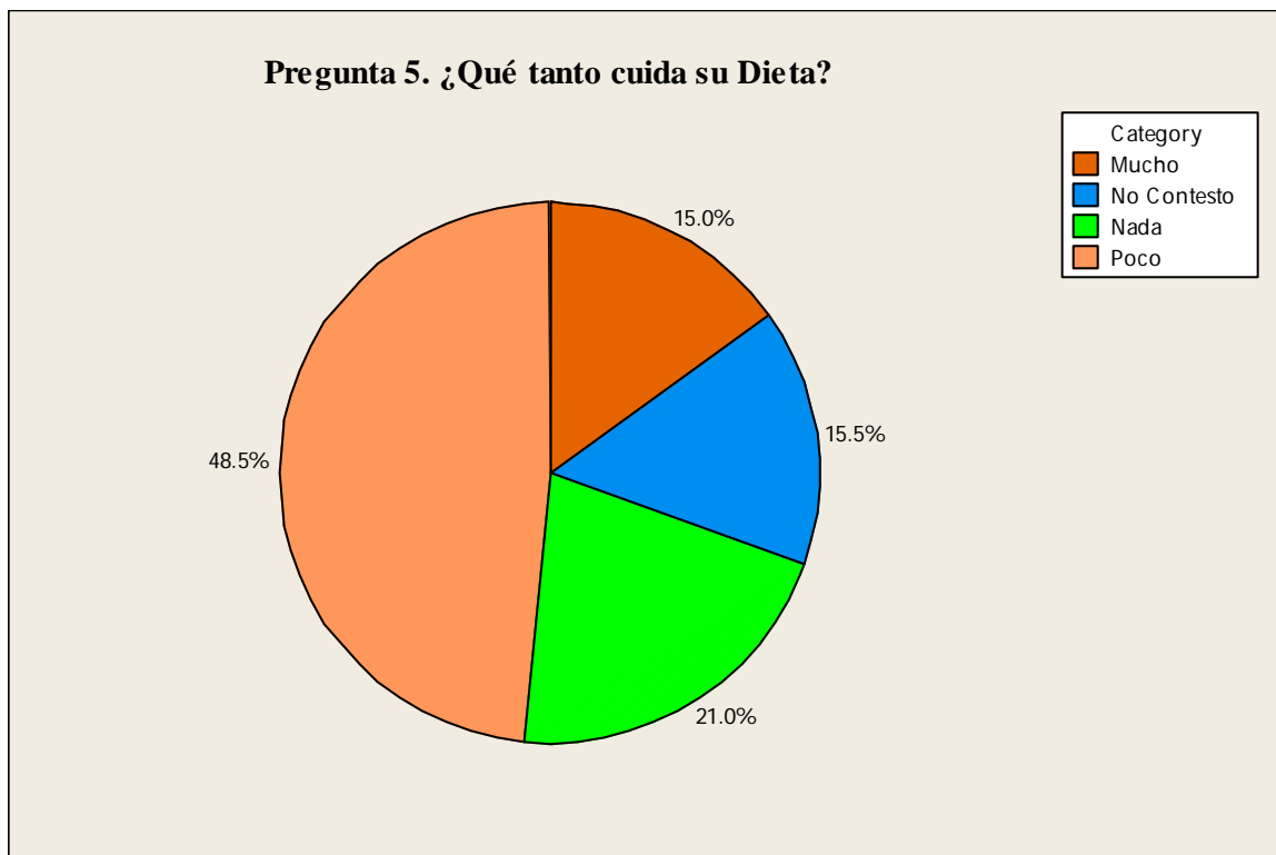
Figura 4.4 El Cuidado de la Dieta.

En este punto, se trató de averiguar que tanto cuida su dieta el diabético, ya que para ellos es la forma más importante para controlar los niveles de glucosa en la sangre a parte de la medicación. A pesar de ello, los resultados arrojaron que el 48.5% cuida un poco su alimentación, mientras que un 15% sí la cuida. Esta negligencia por parte de los diabéticos es por la falta de interés por comer variado y balanceado según sus necesidades, por eso es importante la elaboración de un menú especial para ellos ( Ver Figura 4.5 ).