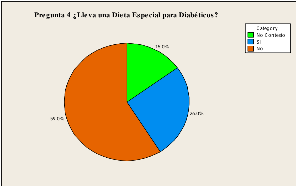
Figura 4.1 Llevar una Dieta Especial para Diabéticos.