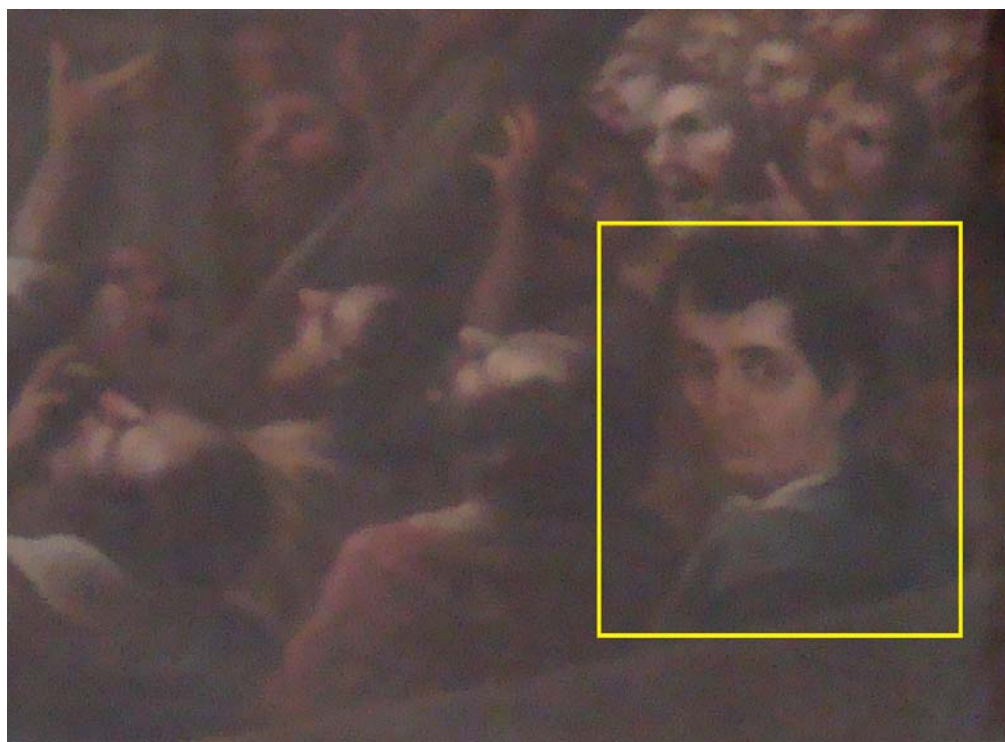
Imagen No.14 Detalle del gran lienzo que cubre el muro lateral izquierdo de la nave e la capilla de la Soledad en la Parroquia de San Juan Evangelista en Acatzingo, Puebla, en el cuál se observa su autorretrato.

Si bien el trabajo anatómico de sus figuras no es lo más destacable de su obra, si lo es el magnífico uso del color y la luz. Se aprecia en algunos de sus lienzos el uso de claroscuros, principalmente en los grandes lienzos que narran la Pasión de Cristo y que adornan la capilla de Dolores y la de la Soledad en la Parroquia de San Juan Evangelista en Acatzingo Puebla, en una de las cuales incluyó su autorretrato.