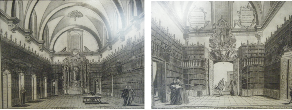
Imagen No.15 y 16 Grabados de la Biblioteca Palafoxiana parte I y II respectivamente. Colección particular.