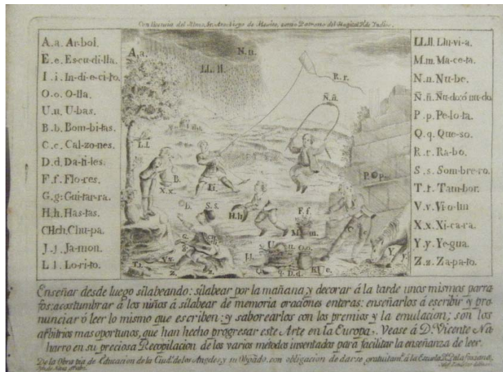
Imagen No.17 Grabado del silabario palafoxiano. Colección particular.

Por la cantidad de obra que realizó, debió de haber tenido un taller en donde trabajaban varios asistentes y aprendices, entre los que destaca el pintor poblano Julián Ordoñez (1784) 13 .