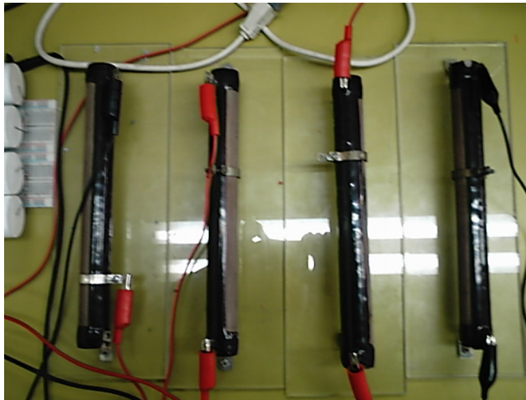
A.4 Resistencia de Carga Vista Superior