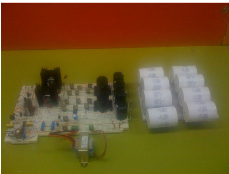
A.2 Circuito Prototipo Final Vista Lateral