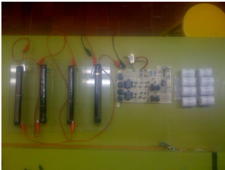
A.1 Circuito Prototipo Final Vista Superior