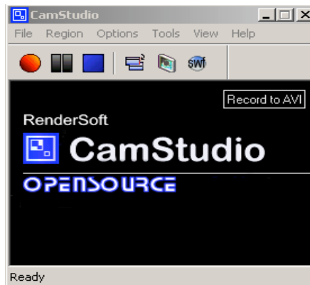
Figura 3.1 Interfaz de CamStudio