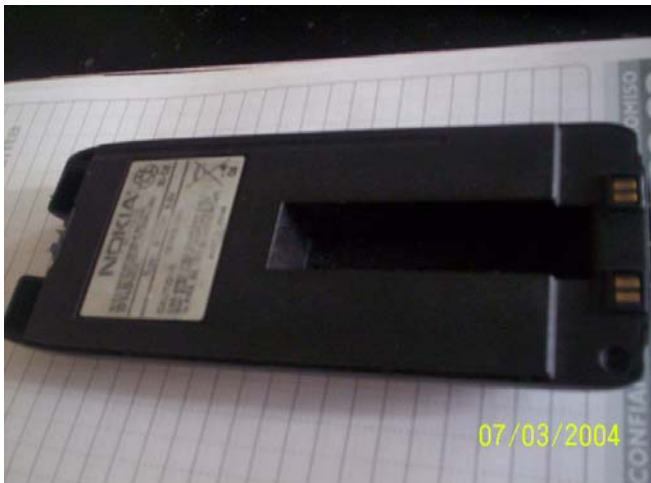
Foto 37 Batería de Celular de Ni Cd