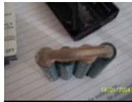
Foto 12 Pilas