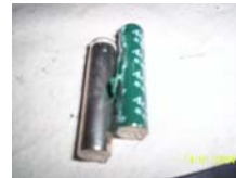
Foto 13 Pila con y sin envoltura