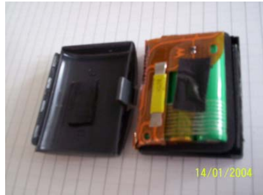
Foto 18 Pilas dentro de la batería