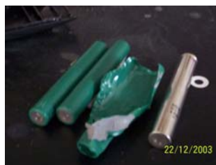
Foto 5 Pilas con y sin envoltura plástica