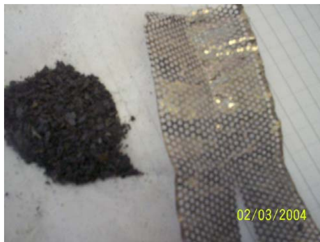
Foto 44 Placa metálica y metal