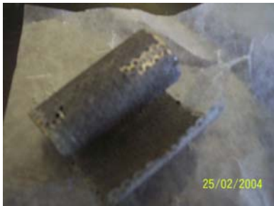
Foto 34 Placa de Cd