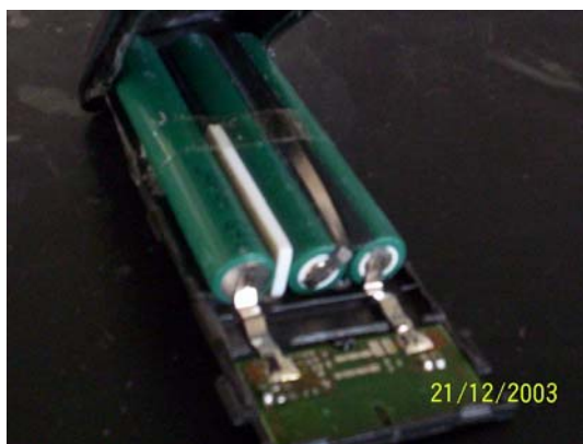
Foto 4 Batería de celular