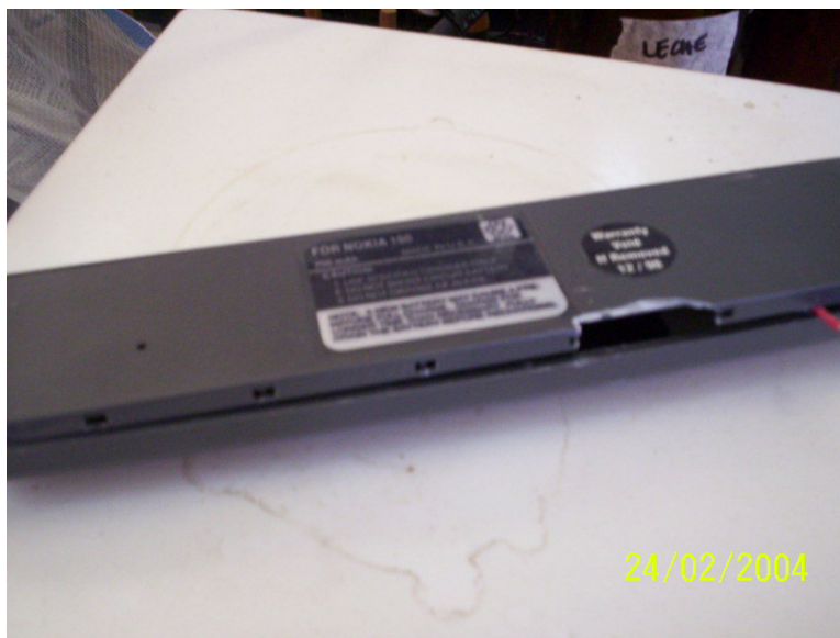
Foto 32 Batera de Celular de Ni-CD