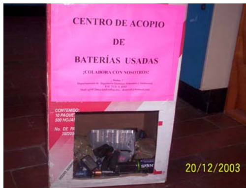
Foto 2 Acopio de pilas