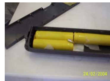
Foto 31 Pilas