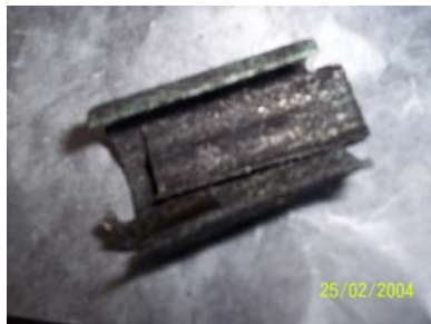
Foto 36 Placa de Ni