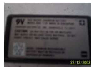
Foto 9 Parte trasera pila de 9V