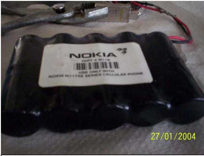
Foto 26 Bateria para uso en reparaciones de celulares