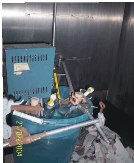
Foto 47 Matraces en baño de reacción