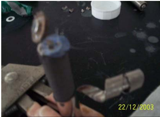
Foto 7 Interior de una pila