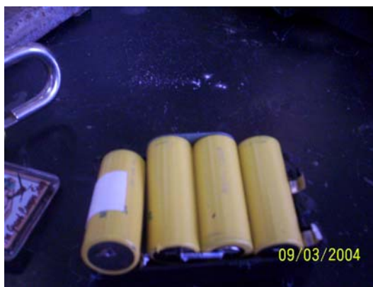
Foto 39 Pilas que contiene la Batería