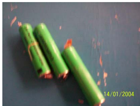
Foto 23 Pilas