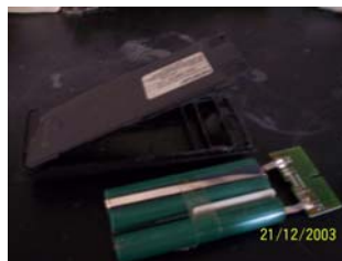
Foto 3 pilas y carcasa