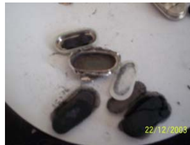
Foto 8 Interior de pila de 9V