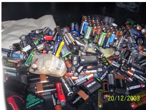
Foto 1 Pilas recibidas en el acopio