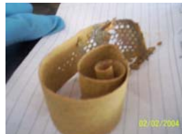
Foto 30 Placa de Ni