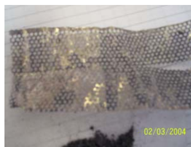
Foto 43 Soporte metálico