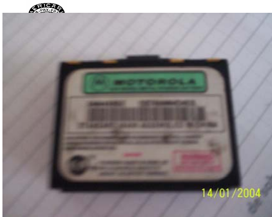
Foto 19 Bateria de Celular de Ni-CD