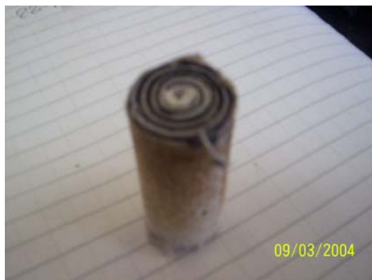
Foto 42 Interior de una pila