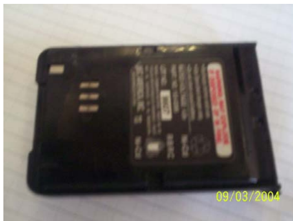
Foto 40 Batería de Celular de Ni-Cd