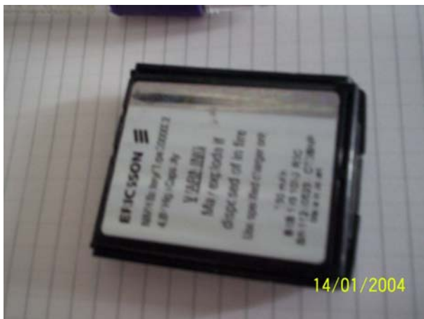
Foto 22 Bateria Ni-Cd