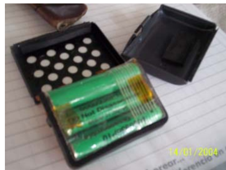
Foto 20 Pilas en la batería