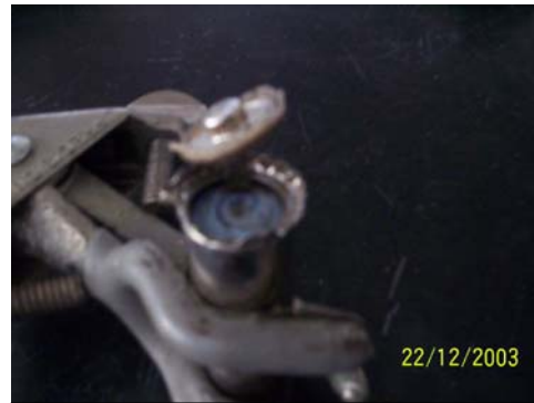
Foto 6 Pila sin tapa