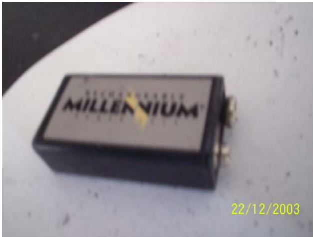
Foto 10 Batería de 9 V de Ni-Cd