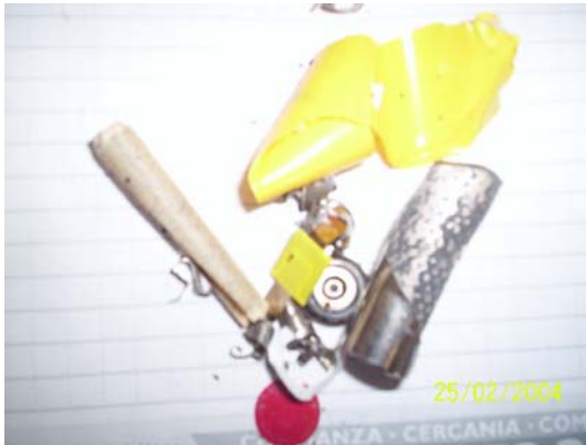
Foto 33 Componentes de una pila