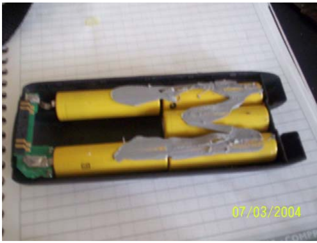
Foto 38 Pilas dentro de la Batería