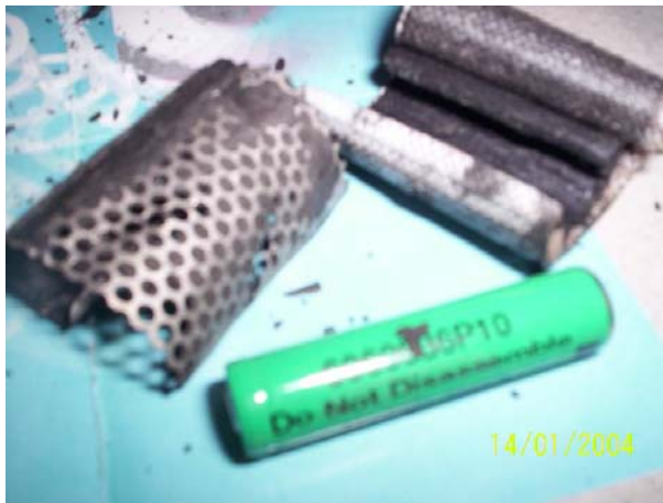
Foto 21 Pilas y placas metálicas