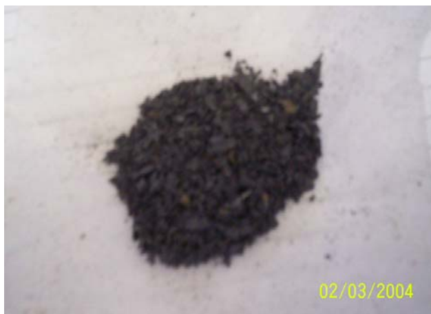
Foto 45 Muestra desmontada del soporte metálico

Dispositivo montado para realizar las pruebas a diferentes temperaturas.