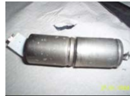
Foto 28 pilas en serie