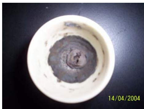
Figura 9.9. Muestra después de calcinación.