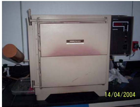
Figura 9.7. Mufla en la que se realizó la calcinación.