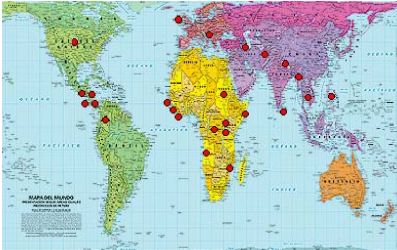
Mapa de Peters

Mapa de Amnistía Internacional 36 , menciona dentro de los países que se encuentran los principales conflictos armados están: