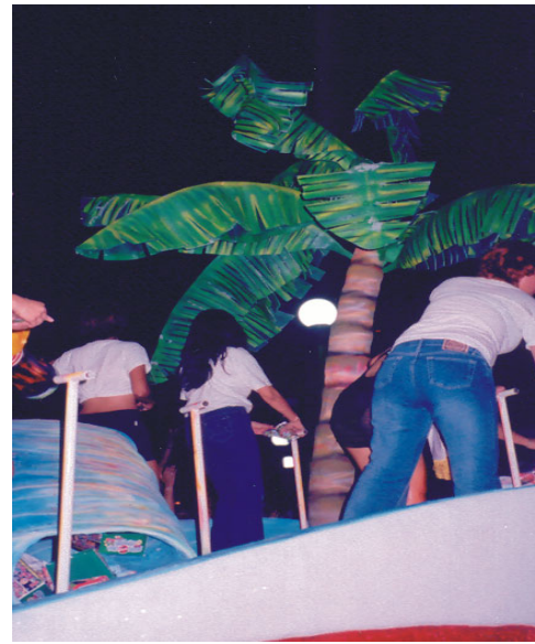
Carros alegóricos del carnaval. (febrero de 2003).