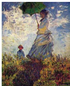
"Monet es el 'ojo', el maravilloso ojo, de acuerdo con su pintura. Yo me quito el sombrero ante él. Es el mejor Impresionista. Es la mano trinitaria, el único al que obedecen el crepúsculo con sus distintos matices y sus colores bien ajustados, sin que, en cambio, sus cuadros parezcan obedecer a un método"

Paul CÉZANNE (pintor francés considerado el padre del arte moderno) a Ambroise Vollard.