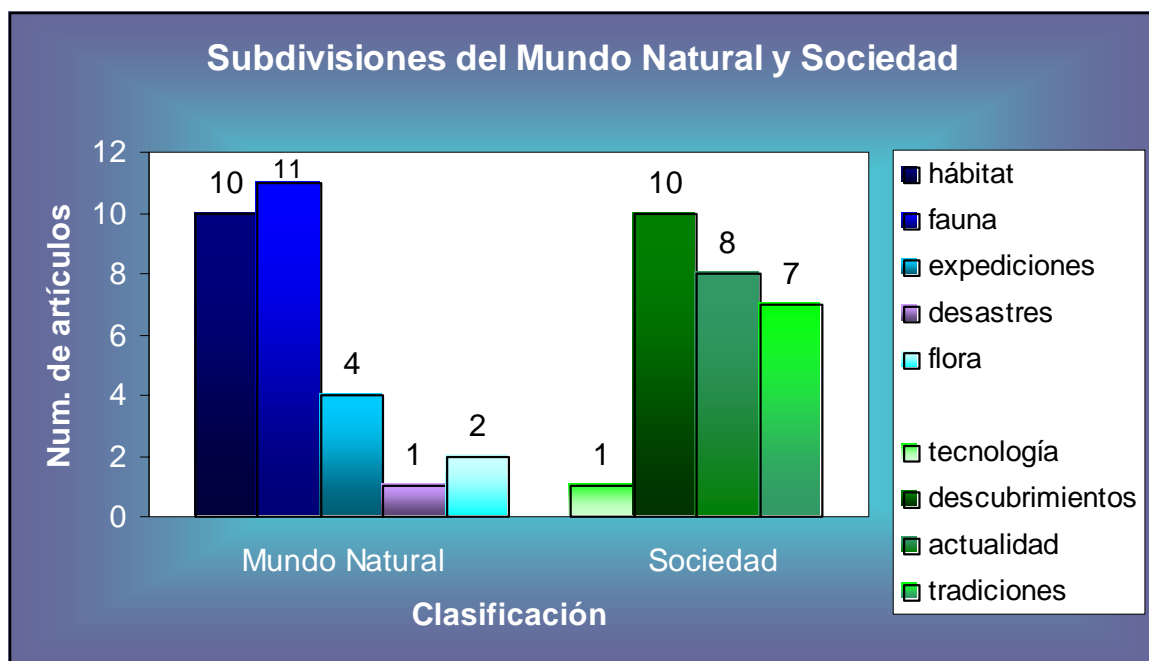
Gráfico 8 – Categorías del Mundo Natural y Sociedad

En el caso de la categoría Mundo Natural los temas que sobresalen son sobre habitats y en segundo lugar fauna. Por otro lado en la categoría de