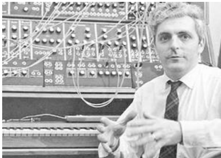
Imagen 4: Sintetizador

Todas las grandes ideas de Robert Moog fueron gracias a la colaboración de músicos, sin ellos Robert Moog y su equipo de trabajo no hubieran podido perfeccionar sus aparatos, es por eso que tenían como norma escuchar todos sus comentarios.