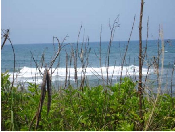
Figura 7.1 La Mancha, Veracruz.