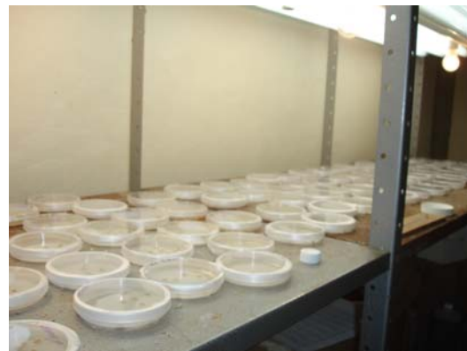
Figura 7.10 Cámara de fotoperiodo.