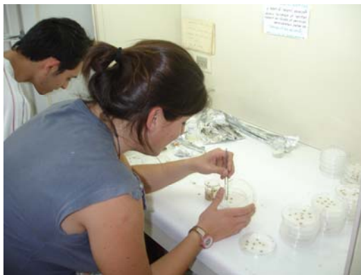
Figura 7.9 Creación de unidades experimentales.