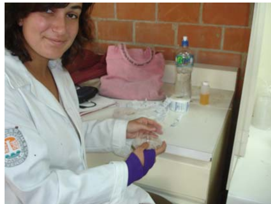
Figura 7.8 Etiquetado.