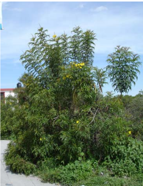
Figura 7.3 Árbol.