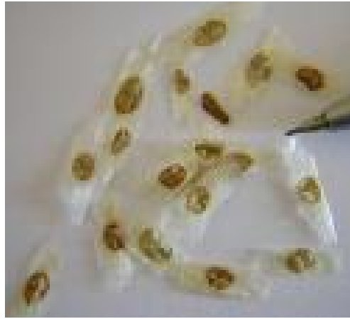
Figura 7.6 Semillas.