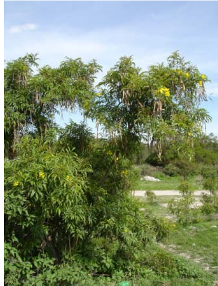
Figura 7.2 Tecalli de Herrera, Puebla.