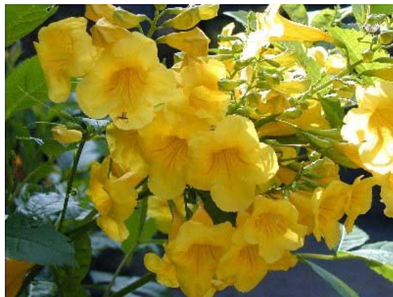
Figura 7.4 Inflorescencia.