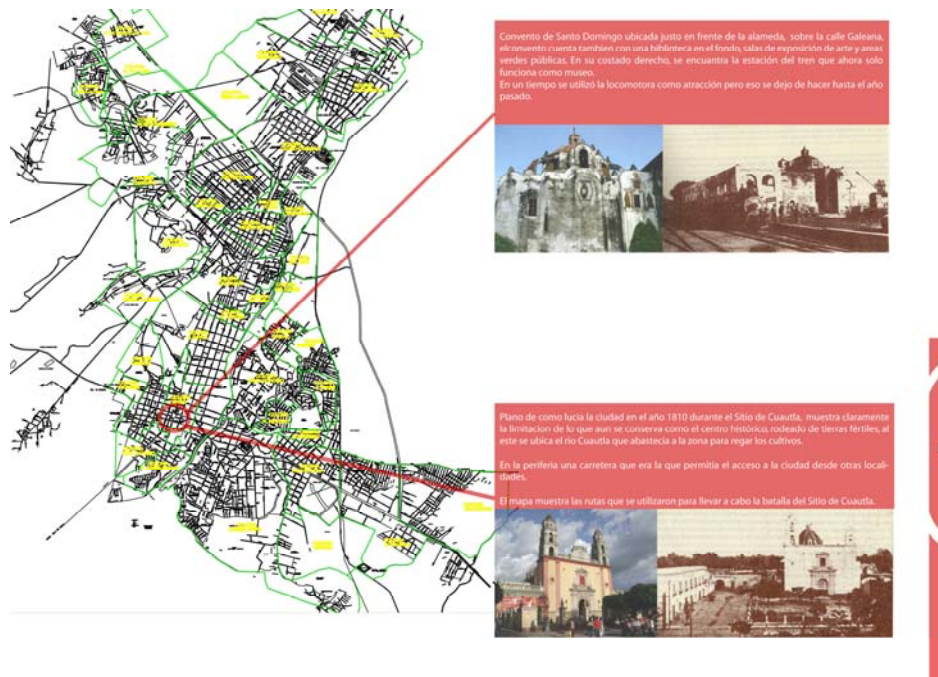
Lámina 3. El Centro Histórico en 1812 (Jaqueline Sánchez Portillo, 2009)