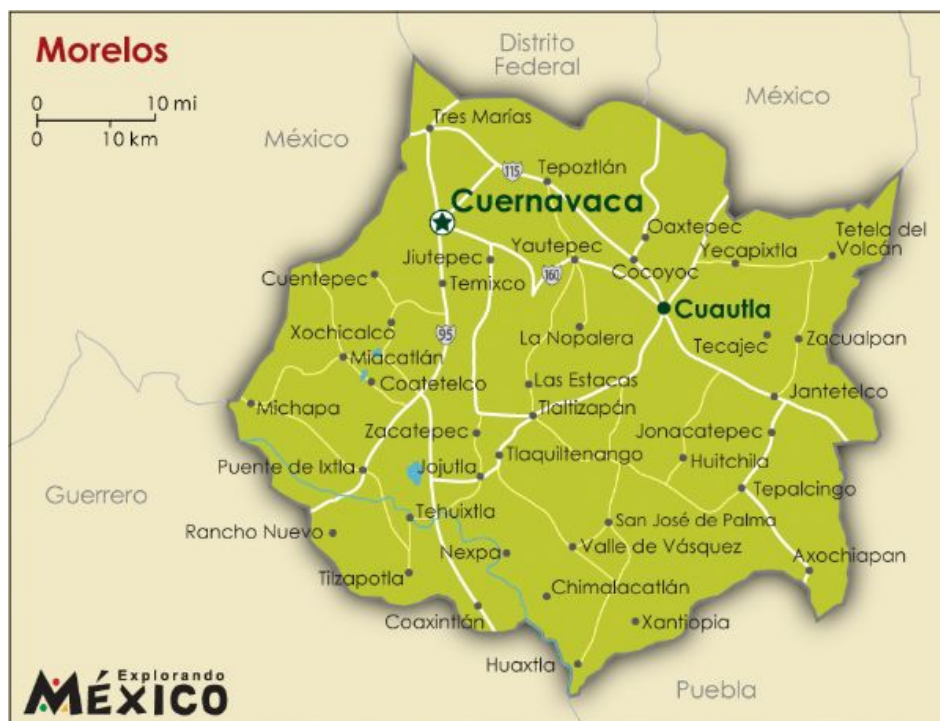
Imagen 12. Mapa de Municipios de Morelos (Explorando México, 2009)

Cuatla colinda con los municipios de Atlatlahucan, Ayala, Yautepec, Yecapixtla y muy próximo a ella se encuentran Ocuituco, Tlalnepantla y Totolapan que son los 3 municipios con mayor pobreza marginal del estado. (Explorando México, 2009) (Véase Imagen 12)