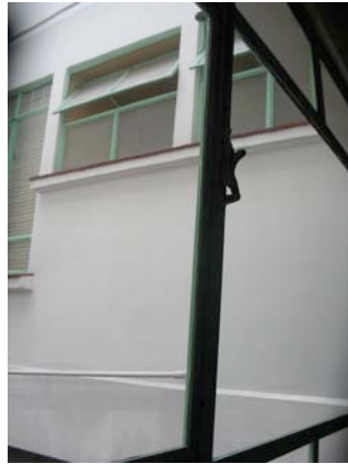
Iluminación natural por medio de posos de luz.