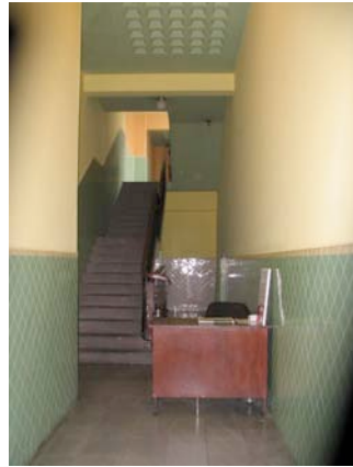
Pasillo de entrada