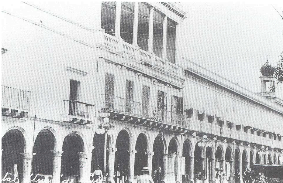
Portal Iturbide en los años 20

El edificio se encuentra en la avenida 16 de septiembre 109 del centro histórico de la ciudad de Puebla.