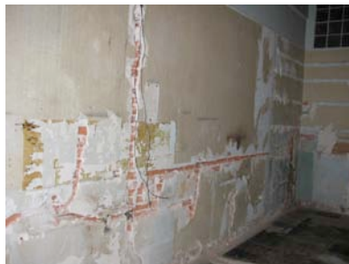
Deterioro en Muros