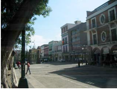
Av. 16 de septiembre