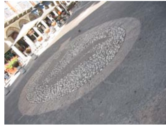
diseño de piso en las esquinas