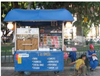
Carritos dulces Típicos.