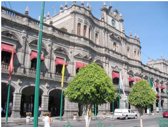
Palacio de Gobierno