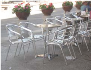
Jardineras y mobiliario externo