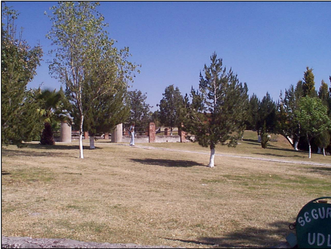
(Pendiente, vista desde el estacionamiento)

El rodeo es un espacio anexo al edificio de la ex hacienda, el cual se integra perfectamente, además se presta para la realización de varios eventos, por su localización que es muy visible y por su forma circular, la cual se adapta, casi a cualquier necesidad.