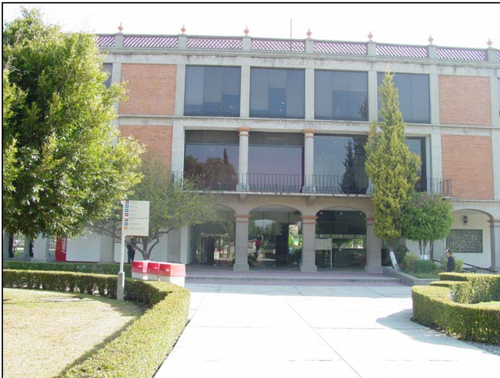
Fachada principal de la biblioteca. UDLAP.

Dentro de la universidad los espacios públicos tienen una gran importancia, pues en ellos es en donde se llevan a cabo la mayoría de las actividades culturales, sociales y recreativas, también son importantes porque organizan mejor los espacios y se agiliza la circulación.