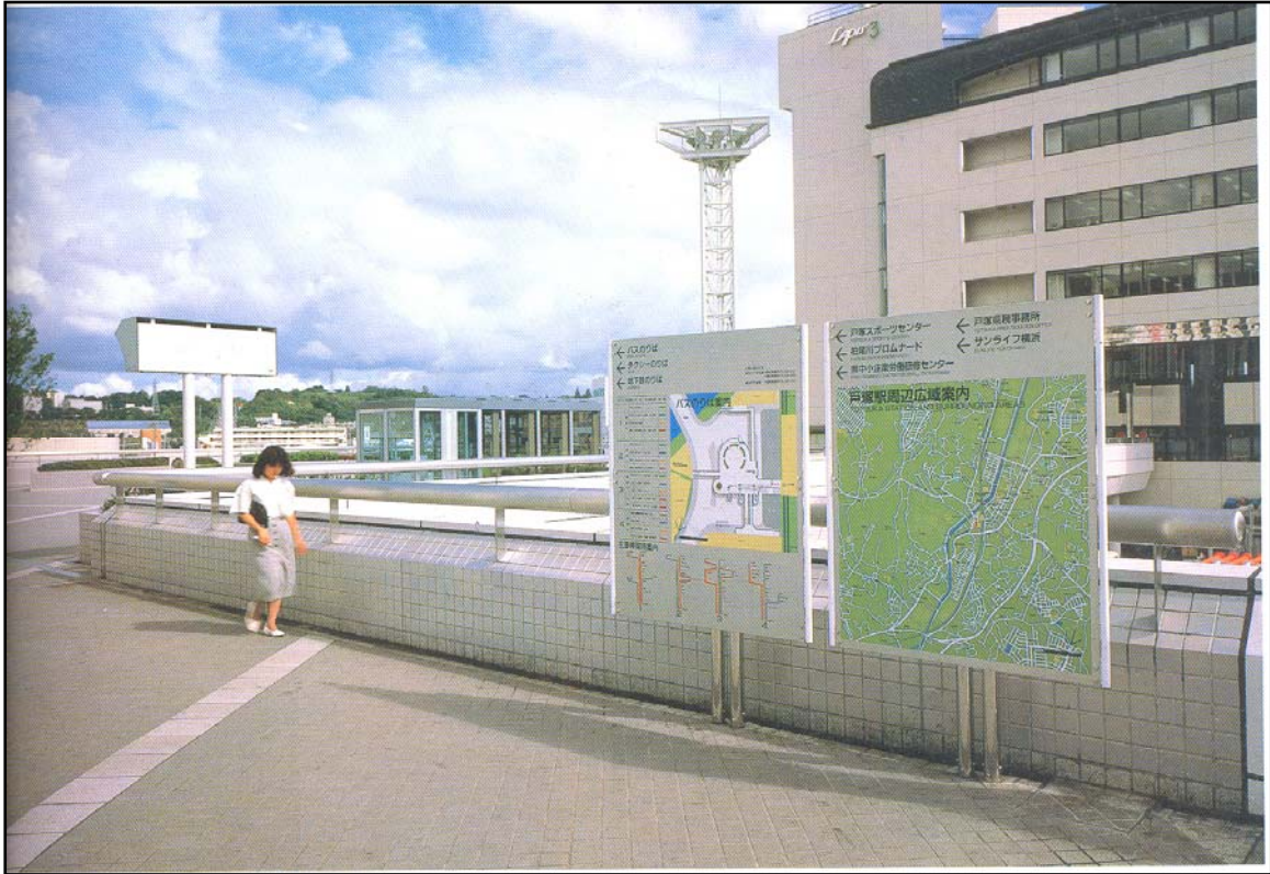
urban landscape design Chief editor, K. T

Es necesario que las plazas y los lugares públicos estén adecuadamente señalizados para que el usuario no se sienta inseguro.