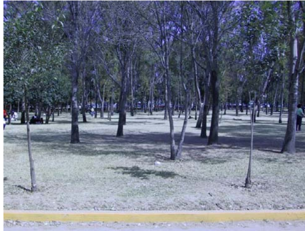
Visita de Campo

(cupressus s.p.,) pirus (schinus molle), truenos (ligustrum japonicum), casuarina (casuarina equisetifolia) y plantas arbustivas como: calestamo (callistemon citrinus), piracanto.