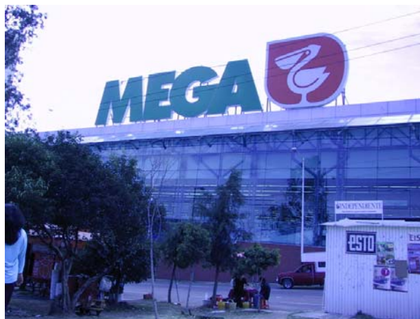
Visita de Campo

Del lado en donde se ubica nuestro terreno y colindando con el Parque Naucalli, sobre el Boulevard Santa Cruz, se encuentra otro espacio de carácter comercial, Comercial Mexicana, el cual alberga una serie de locales, en donde la gente va de compras o a hacer ejercicio, tal es el caso del Sport City. La ventaja de este inmueble es la vista hacia nuestro terreno, que por su altura, permite el dirigir la mirada hacia la Sala de conciertos a diseñar.