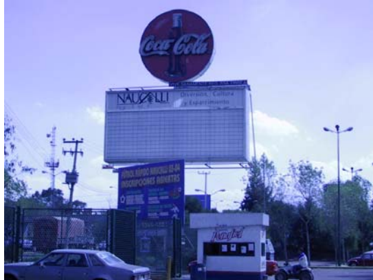
Visita de Campo

Al acceder al parque por esta avenida principal, se accesa directamente a uno de los estacionamientos del parque. Este estacionamiento cuenta con aproximadamente 270 cajones de estacionamiento, conjuntándose con 6 cajones hechos para minusválidos, incluyendo rampas de acceso para los mismos. De aquí, el perímetro de cada uno de los terrenos que conforman el parque, se localiza una serie de corredores, que se utilizan para la circulación de personas, así como de bicicletas, patinetas, cochecitos, etc.