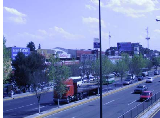
Visita de Campo

Del lado en donde se ubica nuestro terreno y colindando con el Parque Naucalli, sobre el Boulevard Santa Cruz, se encuentra otro espacio de carácter comercial, Comercial Mexicana, el cual alberga una serie de locales, en donde la gente va de compras o a hacer ejercicio, tal es el caso del Sport City. La ventaja de este inmueble es la vista hacia nuestro terreno, que por su altura, permite el dirigir la mirada hacia la Sala de conciertos a diseñar.