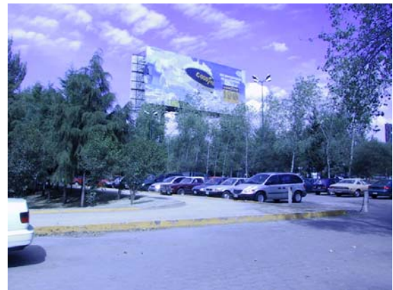
Visita de Campo

Enfocándonos ya hacia el terreno en donde se diseñará la Sala de conciertos. Éste cuenta con una serie de corredores en su perímetro, incluyendo un corredor central que atraviesa el terreno. Este espacio es utilizado principalmente para la meditación, para jugar o simplemente para descansar recostado sobre el pasto. Actualmente el terreno, cuenta con una barrera de árboles, que en mayor de sus casos es casuarina.