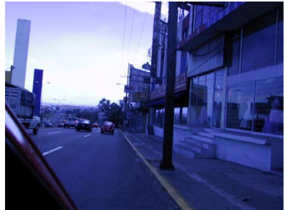
Visita de Campo