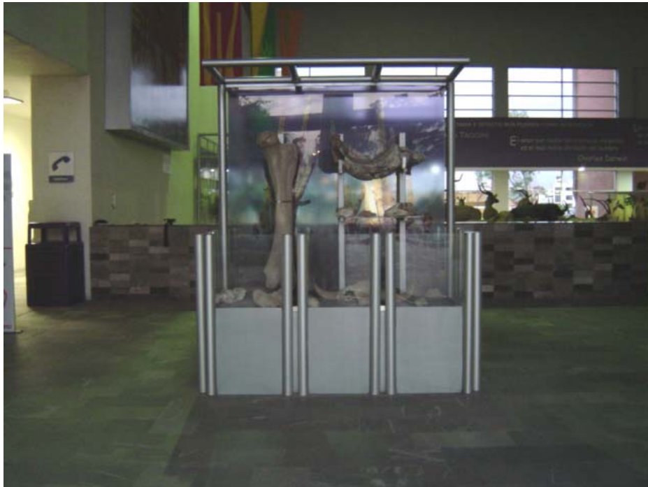
La entrada del Museo

En cuanto al espacio seleccionado, este sería a la entrada del museo siguiendo por la parte derecha hacia el fondo del edificio, a un lado de la cabina de radio. En este lugar el niño puede contar con un espacio propio y tener espacio para los materiales.