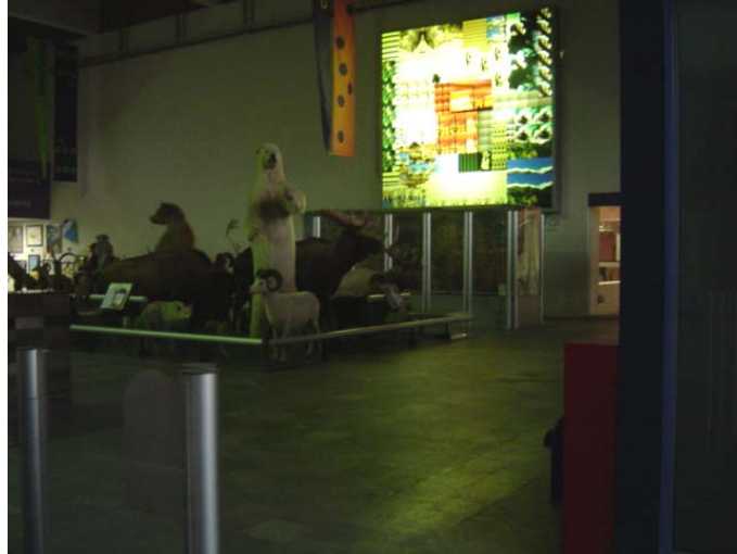
A la entrada del museo hacia el lado derecho