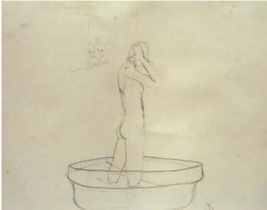
Boceto original de la pza 4