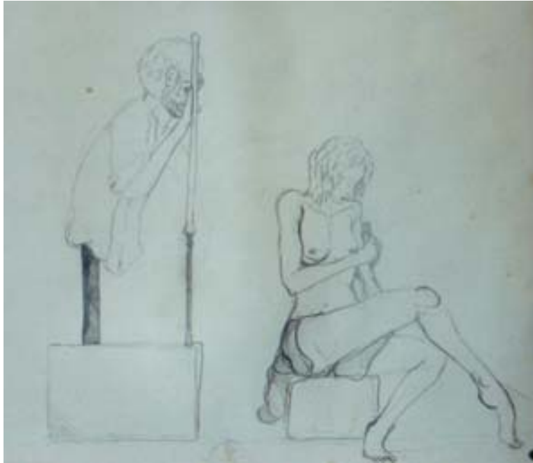
Dibujo para la pieza numero 6