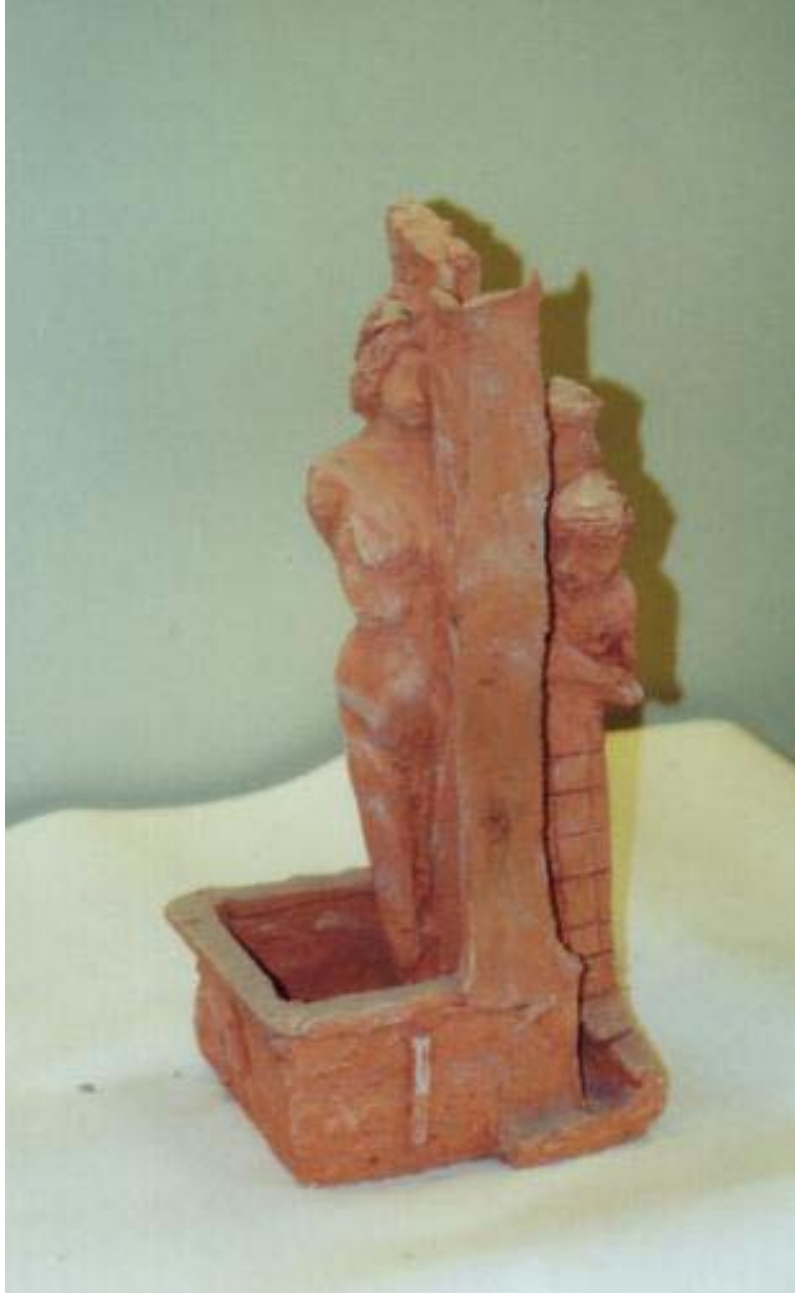
Maqueta de la pza no5