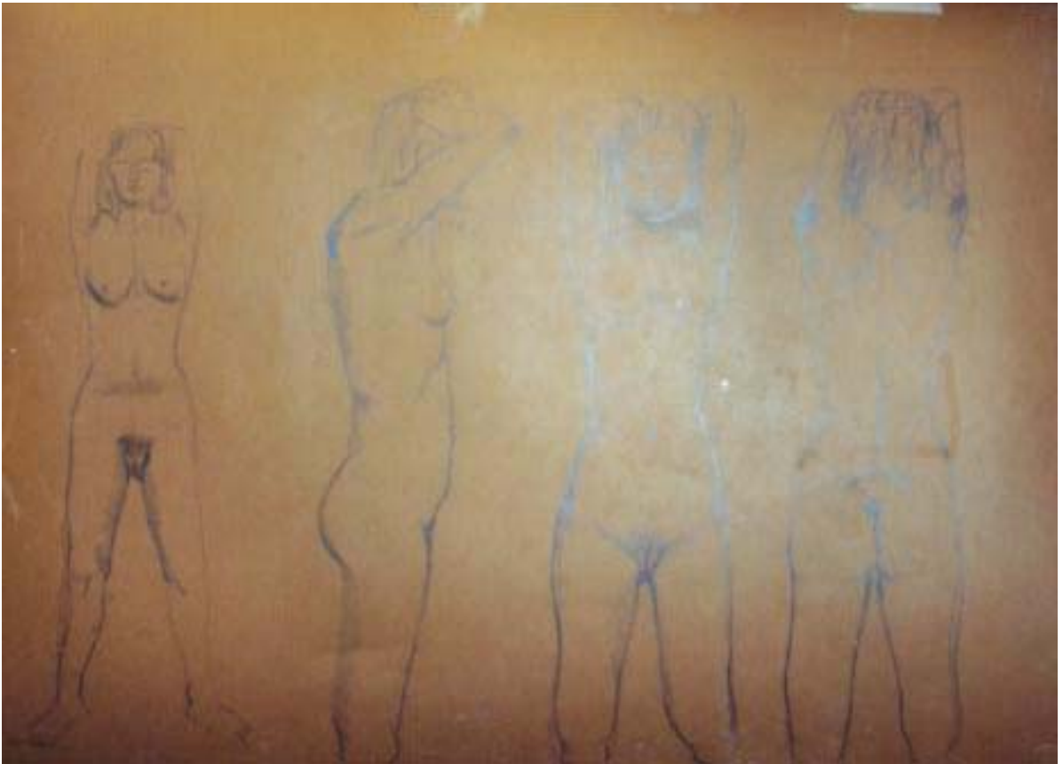
Dibujo con el modelo a esc 1/1 para la pza no 4