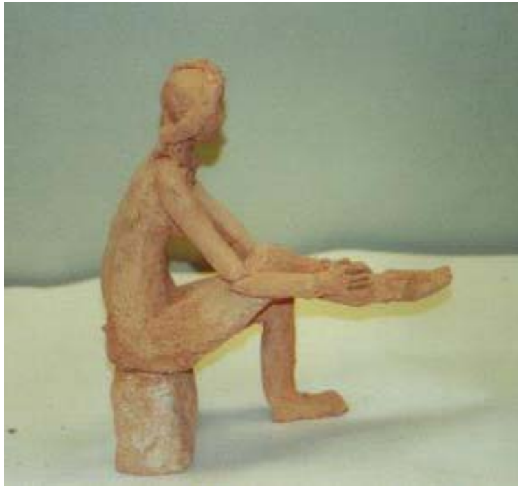
maqueta de trabajo para la pieza numero 6