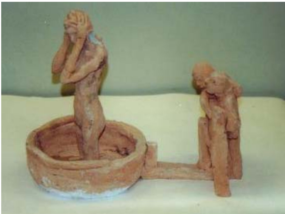
Maqueta de la pieza