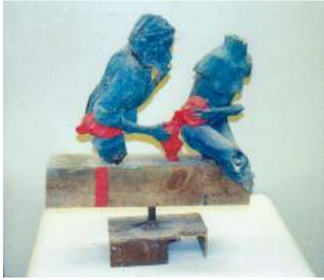
maqueta de la pieza 7