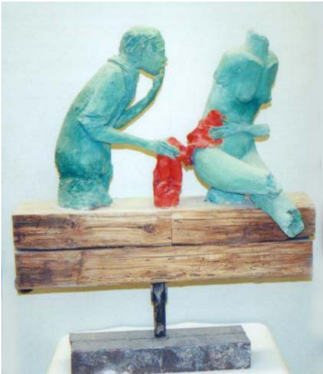
Pieza numero 7

Titulo : Pieza numero 7 de la serie Susana y los viejos .