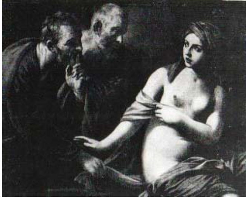
Cuadro de Guido Reni en el que se basa la pieza numero 7