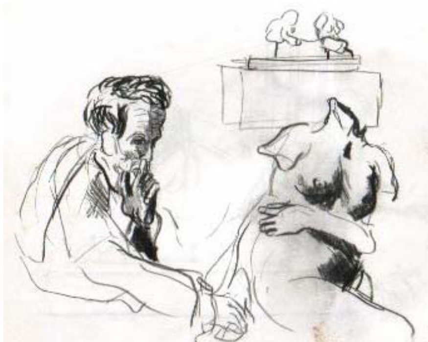
Dibujo a partir del cuadro para el boceto