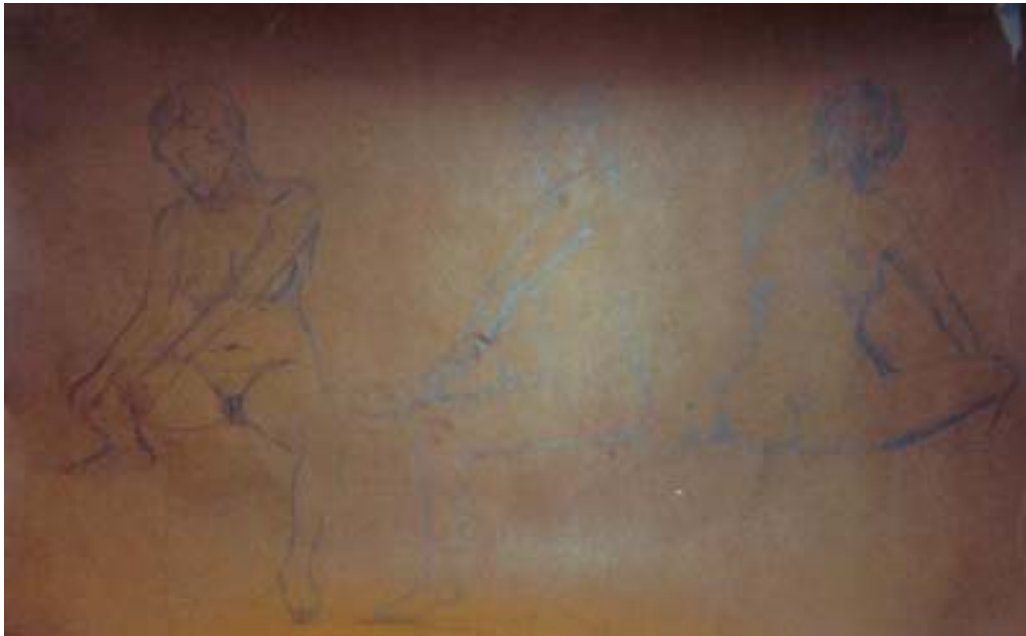
Dibujo con modelo para la pieza numero 6 para realizar pieza a escala 1/1.