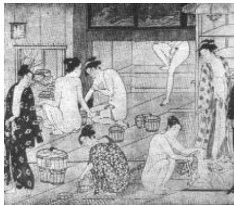
Fig. 3 Kyonaga estampa en color.

El desnudo puede despertar experiencias no solo de necesidades físicas humanas, también tiene la capacidad de evocar recuerdos, armonía, energía, éxtasis, etc, por lo que también puede ser un medio de expresión, el cual pareciera un valor universal eterno. Aunque históricamente no siempre ha sido visto de tal forma, tal es el caso de la estampa japonesa que se limita a una descripción de escenas íntimas, ya que en las culturas china y japonesa por citar algunas, no se ve al cuerpo como un medio de contemplación, actitud que dura hasta la fecha y crea una barrera de incomprensión (fig 3).