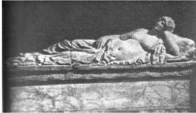
Fig.4 obeso, de una tumba etrusca.

A partir de más o menos un siglo antes de la instauración del cristianismo y de la creación del imperio bizantino, el desnudo había dejado de tener vigencia y se enfoca el arte de tema corporal más hacia el retrato y otras representaciones.