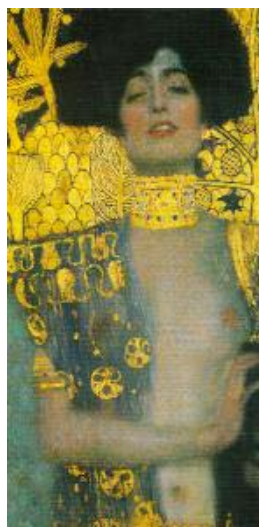
Fig. 7 Judith con la cabeza de Holofernes. Gustav Klimt, 1901; óleo en bastidor