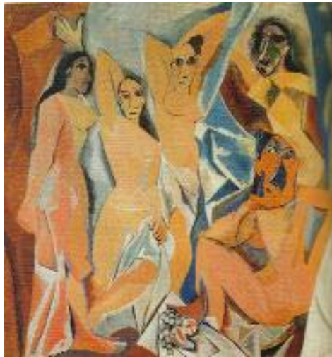
Fig. 8. Les Demoiselles d' Avignon. Pablo Picasso, 1906; oleo en bastidor.

El cuerpo además es representado de manera importante en la pintura del siglo XX como es en el caso del cubismo Fig.8, el surrealismo y otras tendencias importantes de ese siglo. Además de dar al cuerpo un lugar muy importante para el diseño de objetos y arquitectura en corrientes como el funcionalismo por ejemplo el modulator de Le Corbussier, o las vanguardias europeas de los 50 de nuevo con performance, fotografía, etc.