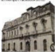
Edificio Gregoire de Wollant, libro Santa María la reina, Arq. Santa Fe, Jc, Cto