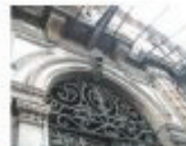
Detalle Herrería Fachada Antonio caso