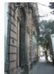
Vista Fachada Antonio caso