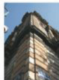
Vista Esquina Antonio caso, Flores Moreno