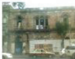
Vista Fachada Antonio caso