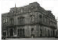
Edificio Gregoire de Wollant 1970, la ciudad de México en el en tiempo | facebook 2012