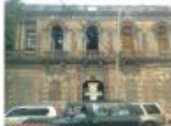
Vista Fachada Flores Moreno