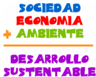
Figura 2.1 Conceptos Integrantes del Desarrollo Sustentable

La siguiente ilustración muestra los integrantes que deben participar activamente para lograr un Desarrollo Sustentable 40 :