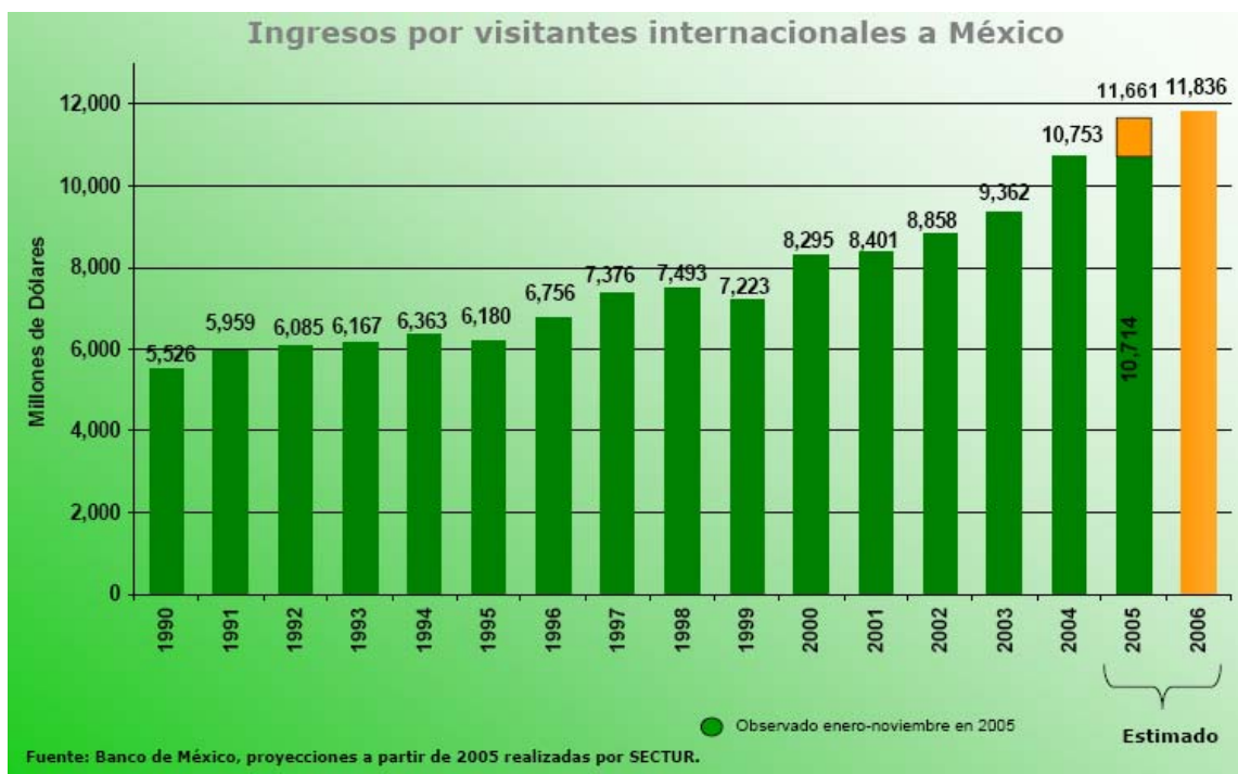
Tabla 2.1 Ingresos por visitantes internacionales a México