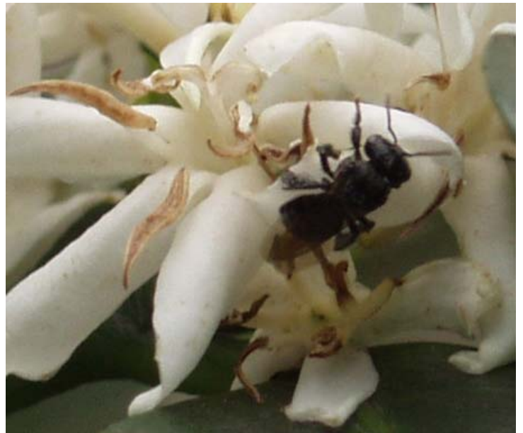
Abeja nativa social