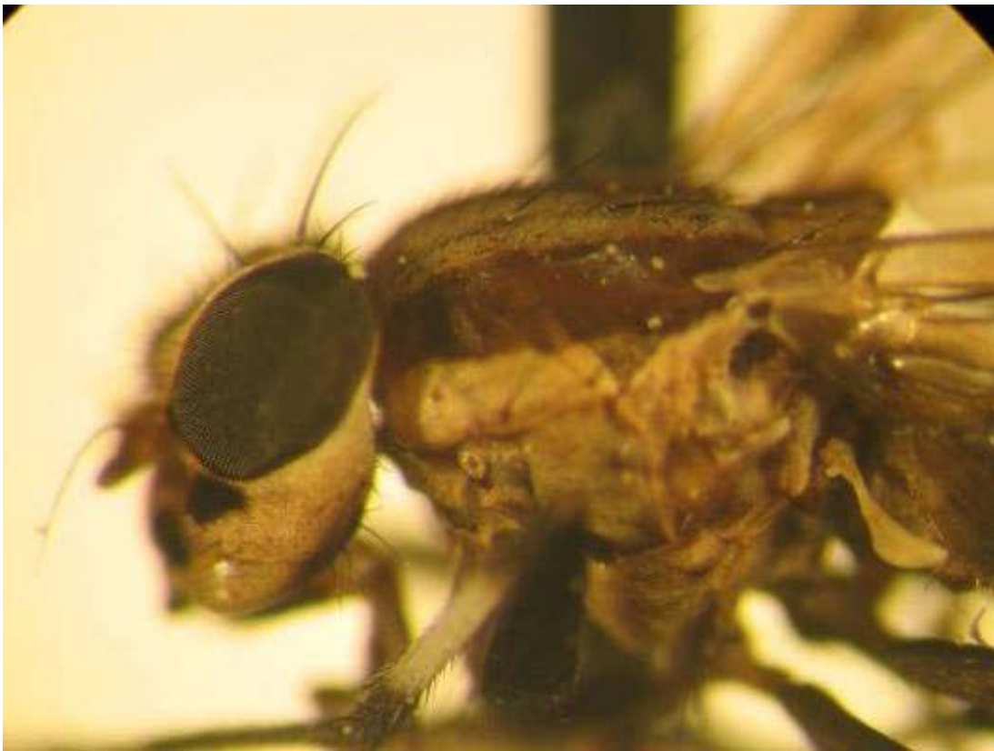
Syrphidae ge. 1