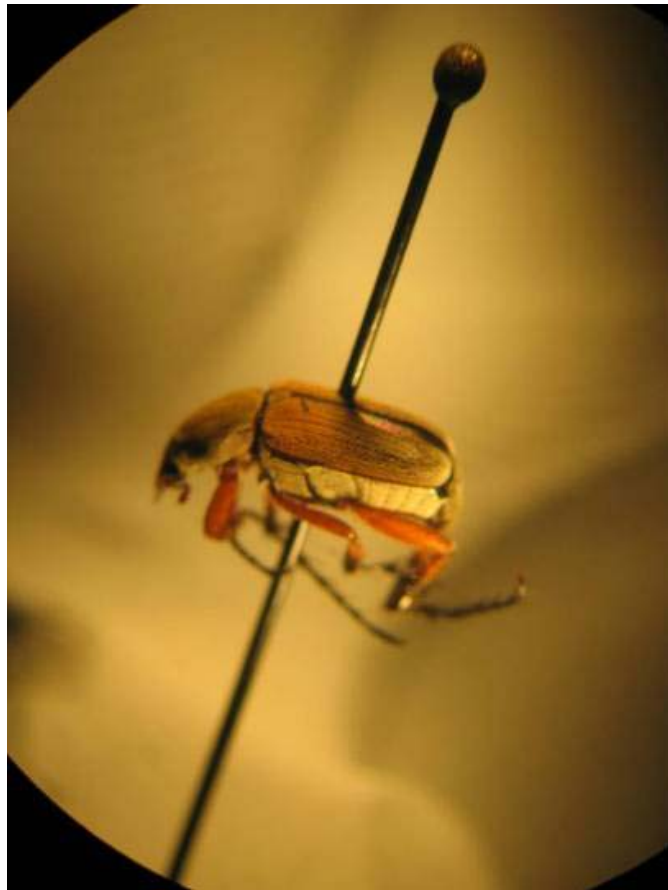
Macrodactylus fulvescens Bortes 1887