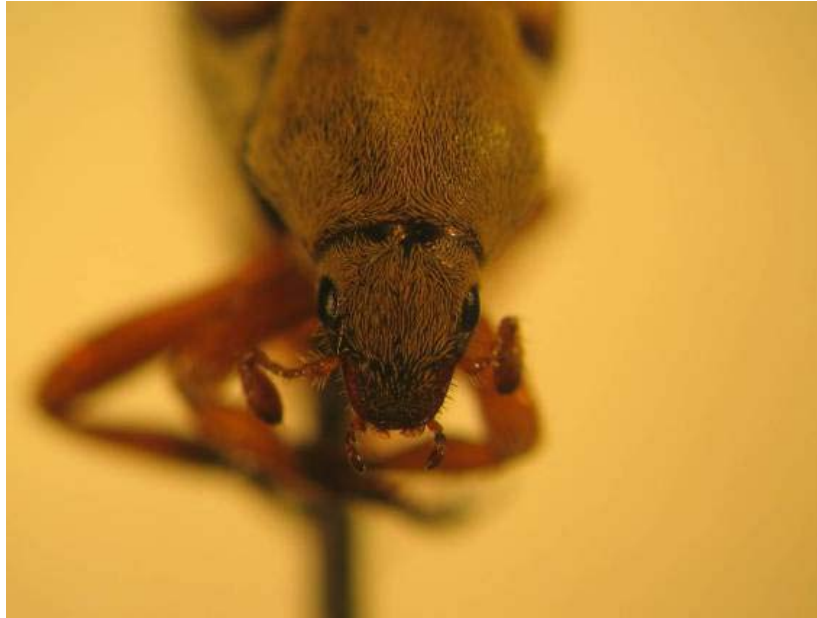
Macrodactylus fulvescens Bortes 1887