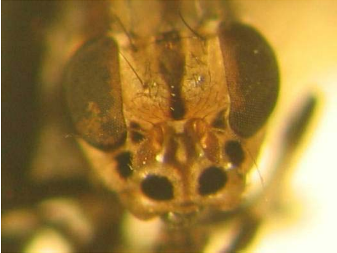
Syrphidae ge. 1