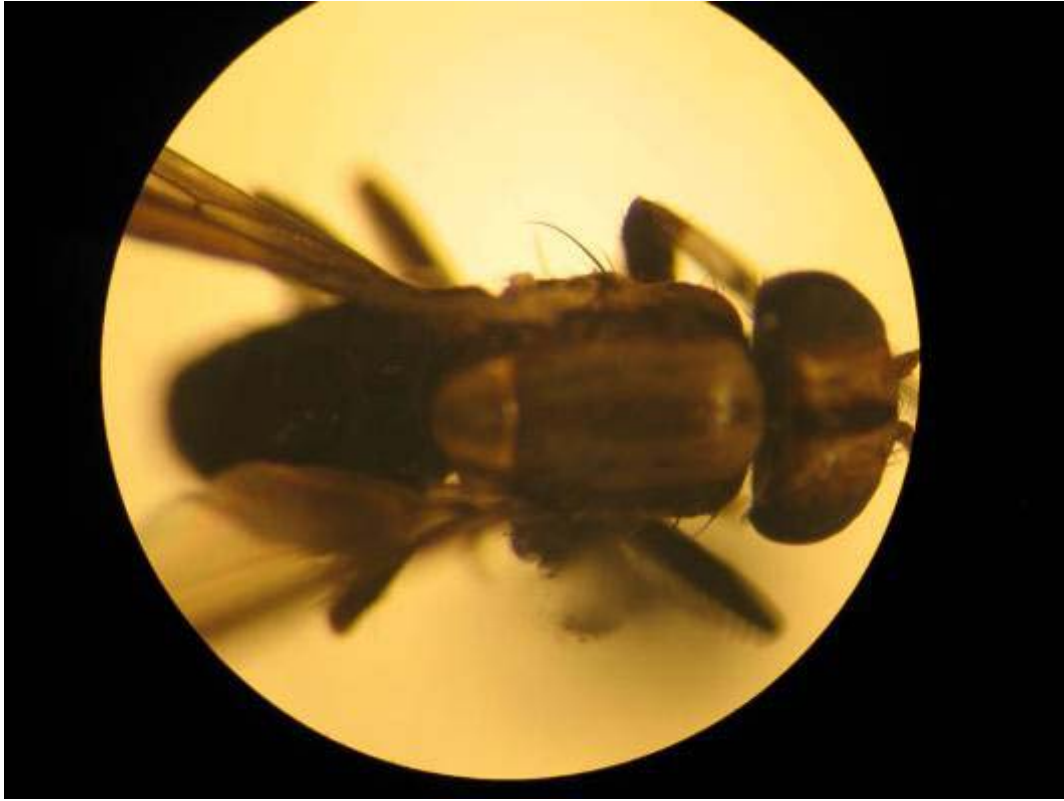
Syrphidae ge. 1