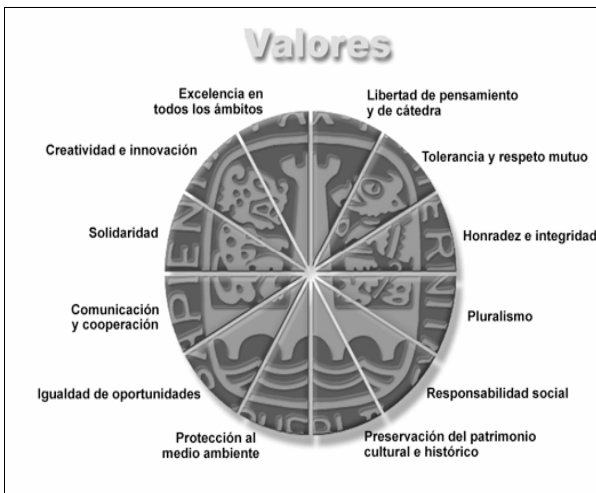
FIGURA 4.1 Valores UDLA-P