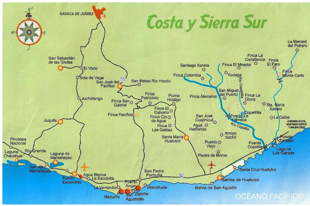
Figura 2. Costa y sierra sur del estado de Oaxaca (Rodiles et al. 2007).